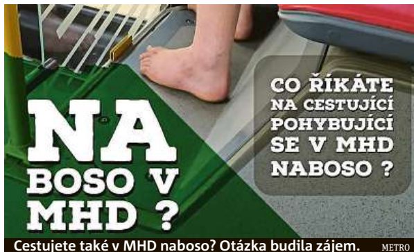
Cestujete také v MHD naboso? Otázka budila zájem.