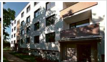
Bytový dům, Brno-Čhrlice