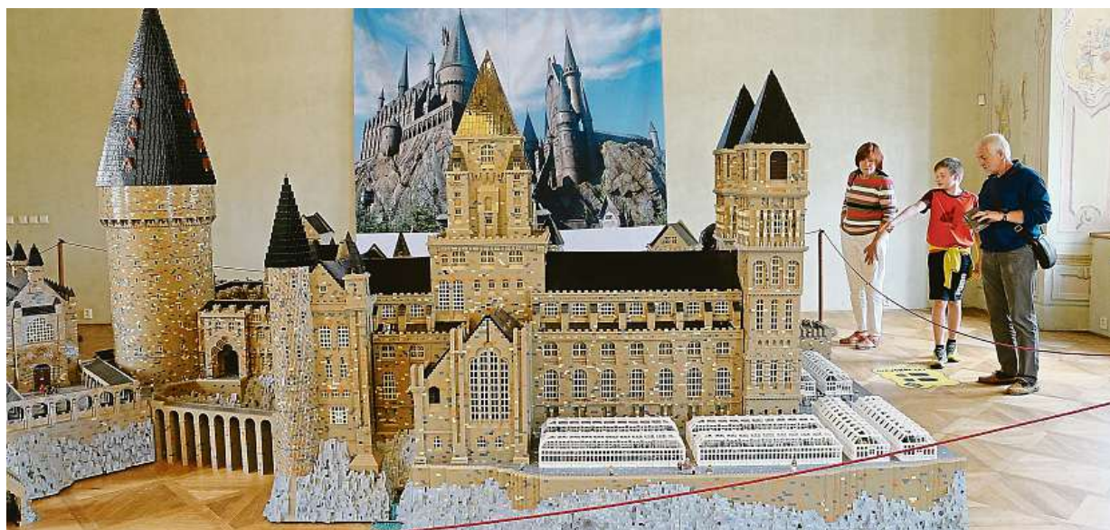
Výstava hradů a zámků poskládaných z kostiček stavebnice Lego bude celé léto k vidění na zámku v Děčíně.

Daň z nabytí nemovitosti. Zrušení 4 procent z kupní ceny schválili poslanci drtivou většinou. Schillerová. „Byla to velmi nespravedlivá daň.“ Odpočty úroků z úvěrů. Zůstanou, přestože je vláda chtěla zrušit STRANA 2