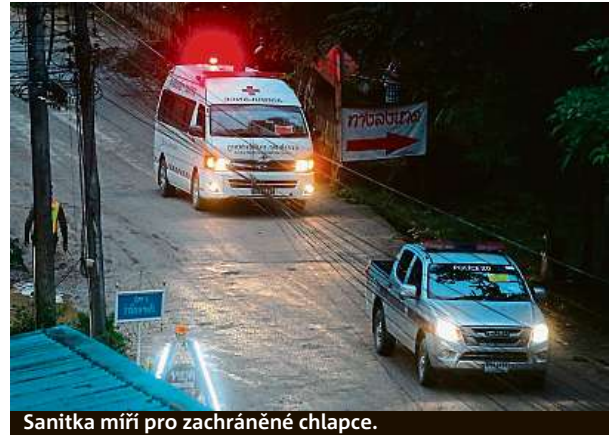
Sanitka míří pro zachráněné chlapce.

a více úseků trasy je schůdných pěšky. Chlapci se pod hladinou přesouvali v úseku asi jednoho kilometru. O tom, kdo bude evakuován nejdříve, rozhodl podle thajských zdrojů australský lékař a zároveň potápěč, který je na místě. Kritériem byla kondice dětí. Ty nejoslabenější