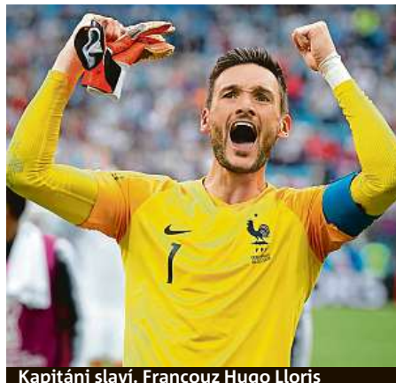
Kapitáni slavi. Francouz Hugo Lloris