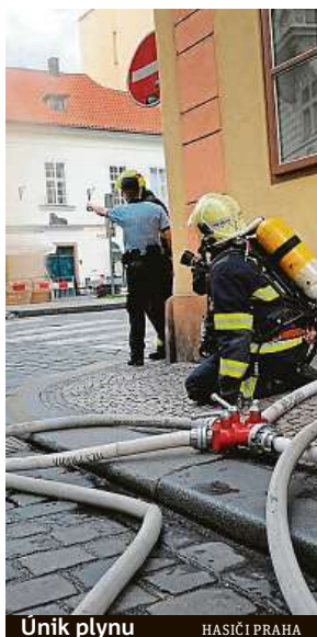
Únik plynu HASIČI PRAHA