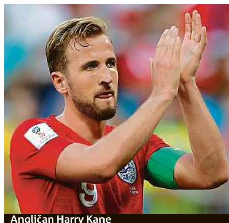
Angličan Harry Kane

Brazílii 2:1 a v zítřejším prvním semifinále vyzve Francii, která po vítězství 2:0 vyřadila další jihoamerický tým, Uruguay. Na ruském turnaji tak skončily i poslední dva neevropské celky. Rudí ďáblové se do semifinále probíjeli poprvé od roku 1986, vyhráli i pátý duel na turnaji a protáhli sérii bez porážky na 24 utkání. Svěřenci Didiera Deschampse si zahrají semifinále poprvé od roku 2006, kdy vybojovali stříbro. ČTK