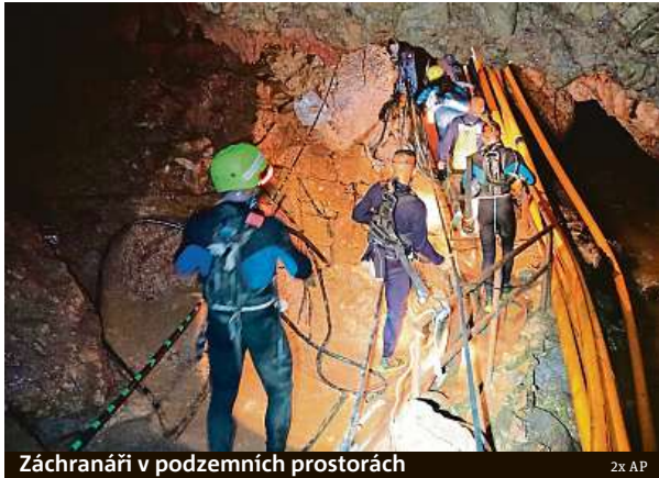
Záchranáři v podzemních prostorách