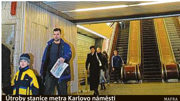
Útroby stanice metra Karlovo náměstí