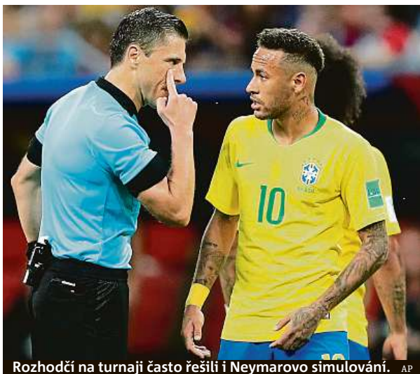
Rozhodčí na turnaji často řešili i Neymarovo simulování.