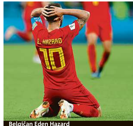
Belgičan Eden Hazard

Francie jde na Belgii. Anglie si to o finále rozdává s Chorvatskem.