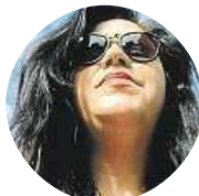
Marii Je Čtyřicet liber. Jela jsem v Londýně načerno.