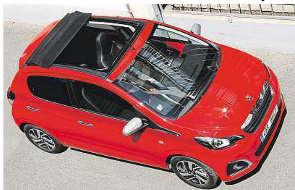
Když je vedro, odhodíte střechu.