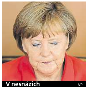
V nesnážích AP

Německá kancléřka Angela Merkelová řeší v současné době zřejmě největší dilema svého mandátu. V budoucnu se na ni může vzpomínat jako na kancléřku, která započala pád eura. Pokud tomu chce zabránit, nezbyvá jí než docílit s Řeckem dohody, kterou v lepším případě odsouhlasí se skřípním zubů její vlastní strana, na reakci veřejného mínění raději nemyslet. V horším případě může o podporu přijít nejen u koaličního partnera, ale dokonce i v rámci své vlastní strany, zabývá se komplikovanou situací německé kancléřky španělský deník El País