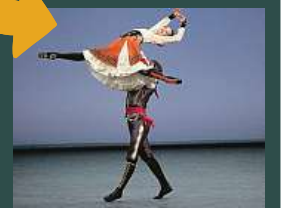
NAPADÁ VÁS VTIPNÝ POPISEK? Napište bublinu a reagujte na sloupek na: www.facebook.com/denikmetro