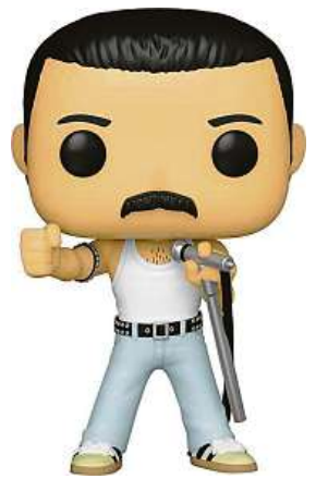
Freddie Mercury FUNKOPOP

Možná už jste je někdy viděli. Roztomilé plastové figurky známých popkulturních postav (Darth Vader, Harry Potter, Lada Gaga nebo Freddie Mercury) s disproporčně velkými hlavami na vás zírají při návštěvě obchodu s hračkami či komiksy. Už více než 20 let je vyrábí americká společnost Funko a dosud jich bylo vytvořeno přibližně 10 tisíc druhů.