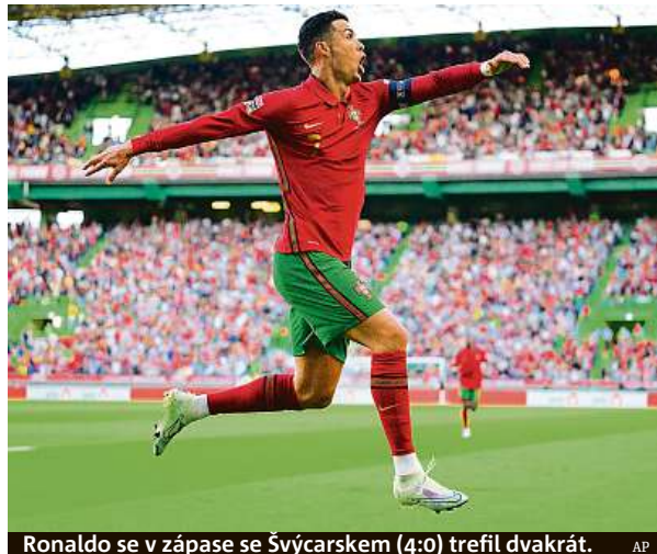
Ronaldo se v zápase se Švýcarskem (4:0) trefil dvakrát.

„Jsme obrovsky rádi, že po dvou domácích zápasech máme čtyři body. Ale nelítáme v oblacích. Víme, že další