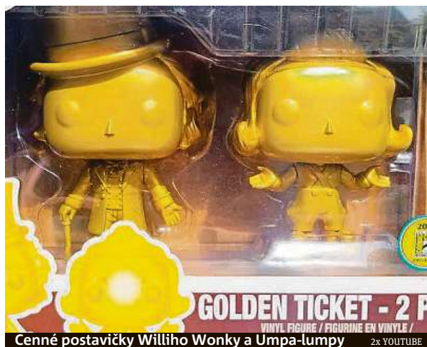
Cenné postavičky Williho Wonky a Umpa-lumpy

Za 100 tisíc dolarů, v přepočtu dva a půl milionu korun, si Grailmonster pořídil vzácnou kolekci dvou postav z filmu Karlík a továrna na čokoládu – Willyho Won-