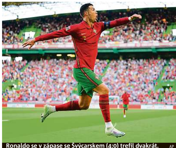
Ronaldo se v zápase se Švýcarskem (4:0) trefil dvakrát.

Portugalci ovládli úvodní ročník Ligy národů, Češi hrají elitní úroveň prvně.