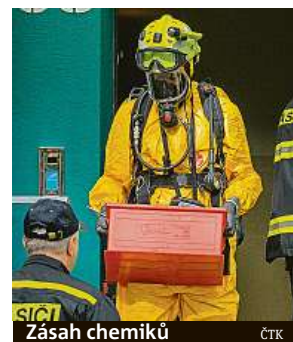
Zásah chemiků

balo mě v krku. Přitom bydlíme docela vysoko a měli jsme otevřené ventilačky,“ popsal noční drama jedna z obyvatel vchodu číslo 63. „Vůbec netuším, co to mohlo být. Nemělo to žádný pach,“ dodala. Zdroj úniku neznámé látky hasiči zatím neznají. IDNES.cz