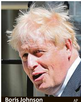
Boris Johnson

Mezi nejhlasitější podporovatele Ukrajiny se řadí věčně rozvrkočený šéf britské vlády.