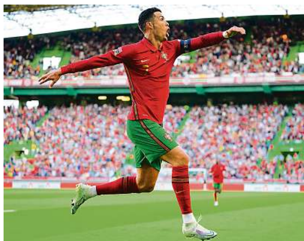
Ronaldo se v zápase se Švýcarskem (4:0) trefil dvakrát.

Portugalci ovládli úvodní ročník Ligy národů, Češi hrají elitní úroveň prvně.