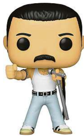
Freddie Mercury FUNKOPOP

v americkém městě Glendale a samotné předání tak trochu připomínalo prodej drog z kriminálních seriálů. Prodávající dorazil s opacněovaným kuffíkem, Grailmonster zase s taškou napěchovanou penězi. Když se pak oba muži přesvědčili, že objekty směny jsou pravé, zapožovali před kamerami a rozešli se šťastní do svých domovů.