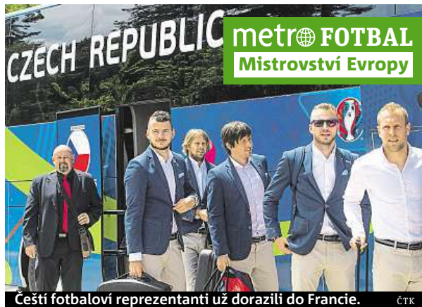
Čeští fotbalisté před vstupem do hotelu v Tours.