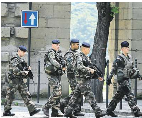
Bezpečnost na prvním místě AP

V minulých dnech zemi postihly také záplavy, jež si vyžádaly čtyři oběti, a hladiny některých řek jsou stále velmi vysoko. Už týden navíc běží stávka železničářů a při samotném šampionátu chtějí stávkovat piloti Air France. Čechům, kteří se na mistrov-