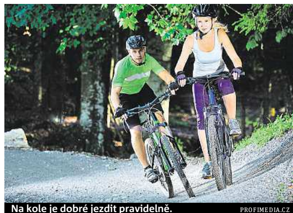
Na kole je dobré jezdit pravidelně.

V posledních letech nabírá na oblibě jízda na in-line bruslích. Stačí je vzít do tašky a třeba po práci si jít zasportovat. Na brusle můžete vyrážet o víkendů s celou rodinou. Obzvláště mezi dětmi je jízda na in-linech hodně oblíbená. „Spolu se zájmem o tento sport ale také vzrůstá množ-