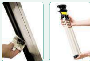
Filtry není třeba nikdy vyměňovat! Stačí je jen občas jednoduše vyjmout a otřít. Účinek filtrace ihned vidíte!

Víte, proč se na horách, v lese, u moře, u splavu či po bouřce cítíte tak dobře? Vědci na to přišli. Je to proto, že na těchto místech je podstatně vyšší koncentrace zdraví prospěšných aniontů kyslíku (záporně nabitých kyslíkových částic) než ve městech, bytech a kancelářích. A víte, že při pobytu v moderním bytě nebo kanceláři nás obklopuje několikrát škodlivější vzduch než je venku?