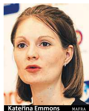
Kateřina Emmons

Olympijská vítězka Kateřina Emmons skončila při prvním startu ve Světovém poháru po mateřské pauze v Mnichově druhá ve střelbě ze vzduchové pušky. Třicetiletá střelkyně ve finále o pouhé tři desetiny bodu prohrála s Martinou Lindsay Velosovou, teprve patnáctiletou senzací ze Singapuru. Do osmičlenného finále postoupila Emmons ze čtvrtého místa a tam ve vyřazovací soutěži prošla až do duelu o titul. ČTK