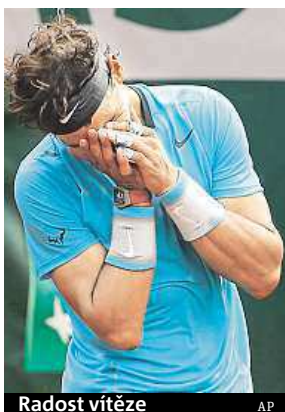
Radost vítěze

Ačkoliv to po prvním setu vypadalo, že by Nadal mohl najít přemožitele, antukový specialista záhy vyvedl všechny z omylu. Největší bitvu svedli oba tenisté ve druhém setu. Další část zápasu sice už podle výsledků vypadá jednoznačně pro rodáka z Mallor-