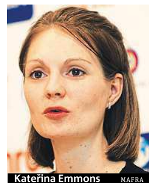
Kateřina Emmons

Olympijská vítězka Kateřina Emmons skončila při prvním startu ve Světovém poháru po mateřské pauze v Mnichově druhá ve střelbě ze vzduchové pušky. Třicetiletá střelkyně ve finále o pouhé tři desetiny bodu prohrála s Martinou Lindsay Velosovou, teprve patnáctiletou senzací ze Singapuru. Do osmičlenného finále postoupila Emmons ze čtvrtého místa a tam ve vyřazovací soutěži prošla až do duelu o titul. ČTK