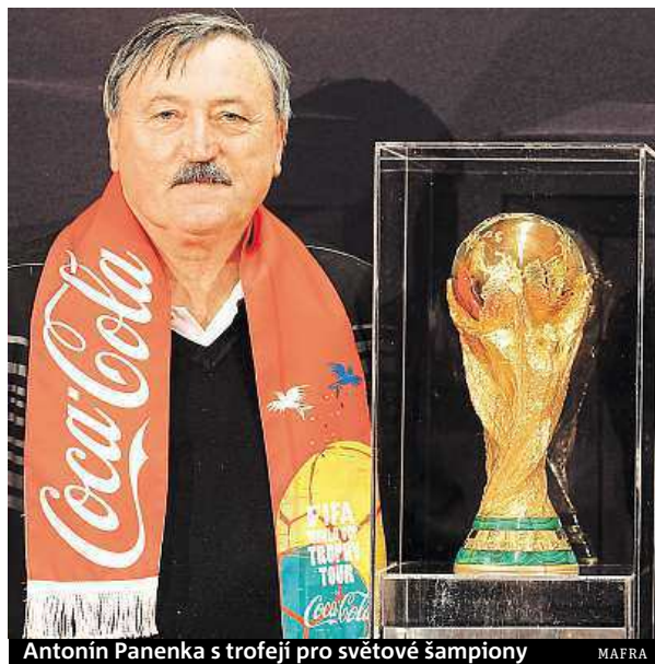
Antonín Panenka s trofejí pro světové šampiony

Myslím si, že by se tam mohl objevit někdo úplně nový. Víme o Messim, o Cristianu Ronaldovi, ale je pravda, že jak Ronaldo, tak Messi v národním mužstvu nejsou takové osobnosti jako v klubech, kde to na ně všichni hrají.