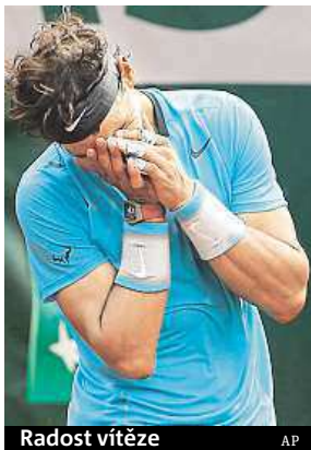
Radost vítěze

Ačkoliv to po prvním setu vypadalo, že by Nadal mohl najít přemožitele, antukový specialista záhy vyvedl všechny z omylu. Největší bitvu svedli oba tenisté ve druhém setu. Další část zápasu sice už podle výsledků vypadá jednoznačně pro rodáka z Mallor-