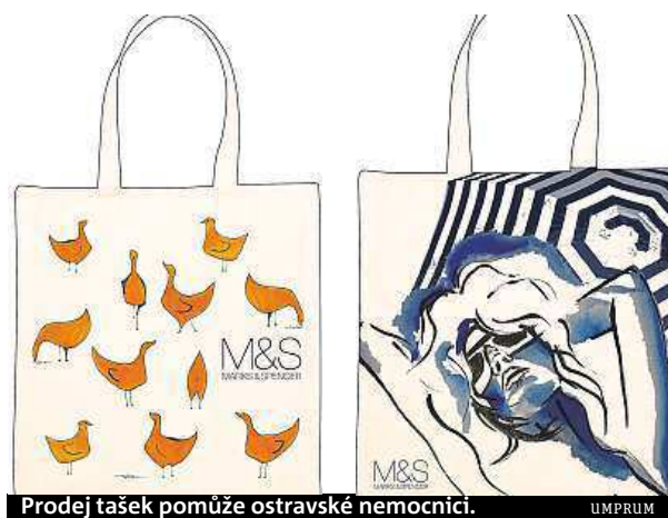
Prodej tašek pomůže ostravské nemocnici.