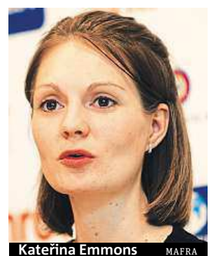
Kateřina Emmons