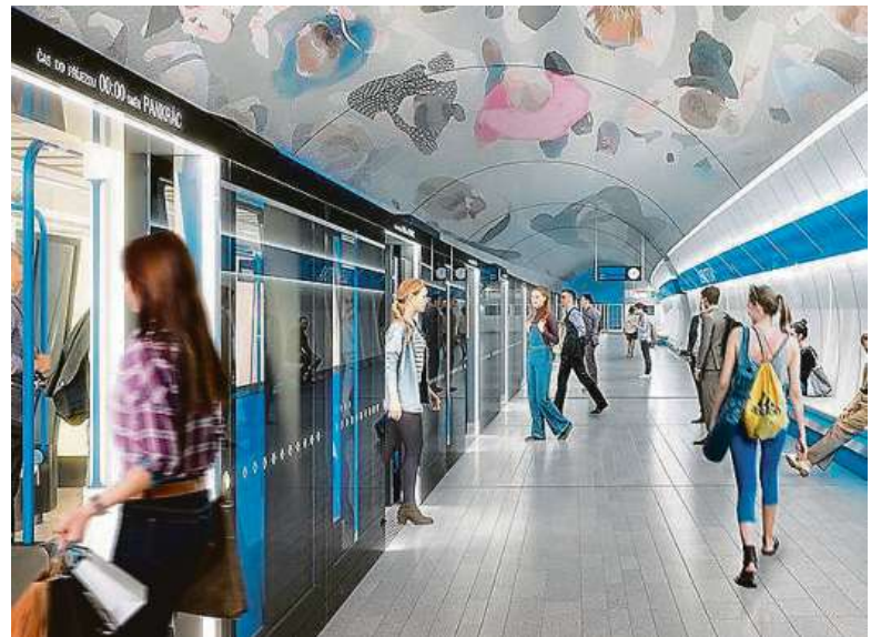
Vizualizace stanice Olbrachtova. Na stropě stanice mají být postavy. Architektem ražené dvojlodní stanice je Pavel Sýs.