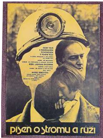
Režisér Ladislav Rychman svým snímkem „oslavil“ československo-sovětské budování pražského metra.

Horší to už bylo ve filmu Píseň o stromu a růži, kam nasadil režisér Ladislav Rychman, autor slavného muzikálu Starci na chmelu, ve spolu-