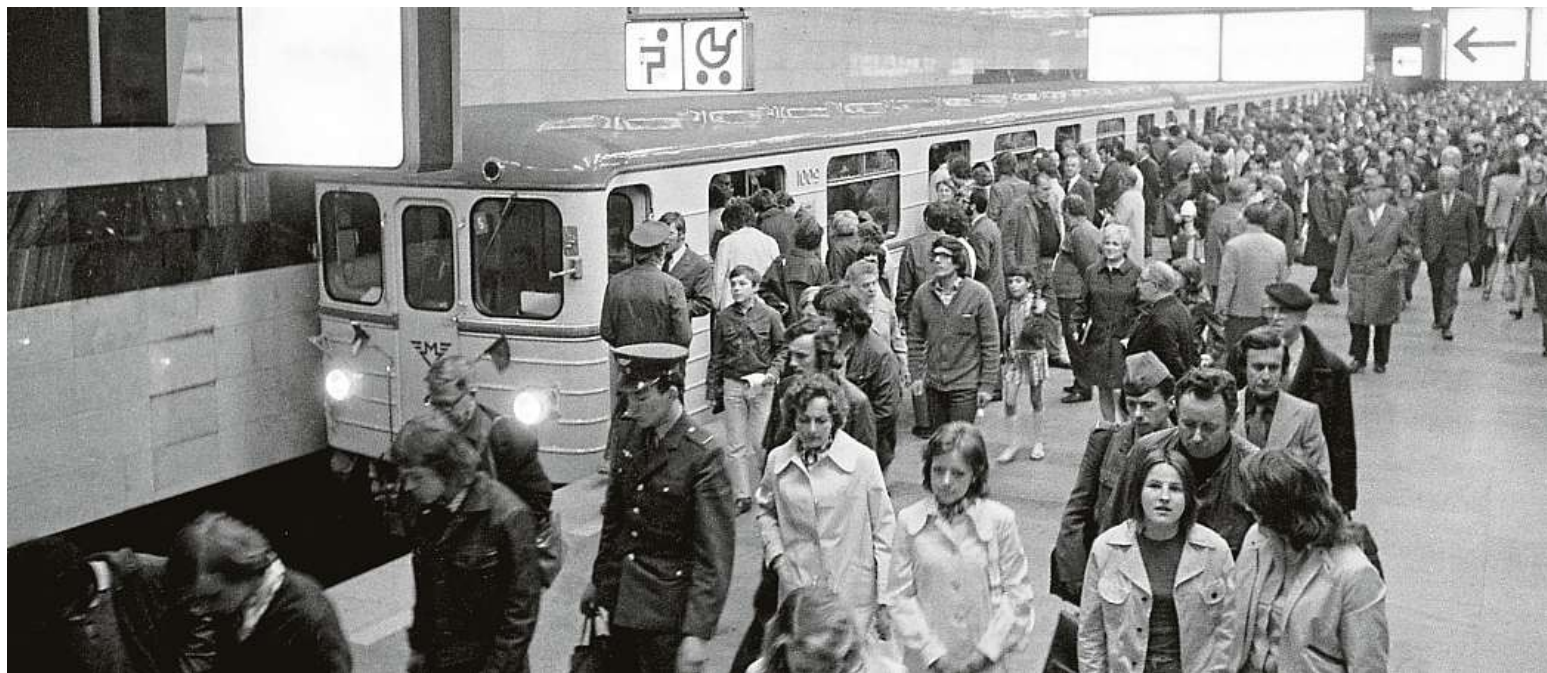
Ve slavnostní den, tedy devátého, bylo metro jen pro zvané, až 10. května 1974 v 5 hodin ráno se mohli svést obyčejní lidé. V první den běžného provozu se jeho vlaky svezlo přes 300 tisíc cestujících. Fotografie je ze stanice Kačerov. Konstrukci stanice tvoří železobetonový rám, nadzemní vestibul navazoval na tehdejší obchodní středisko.