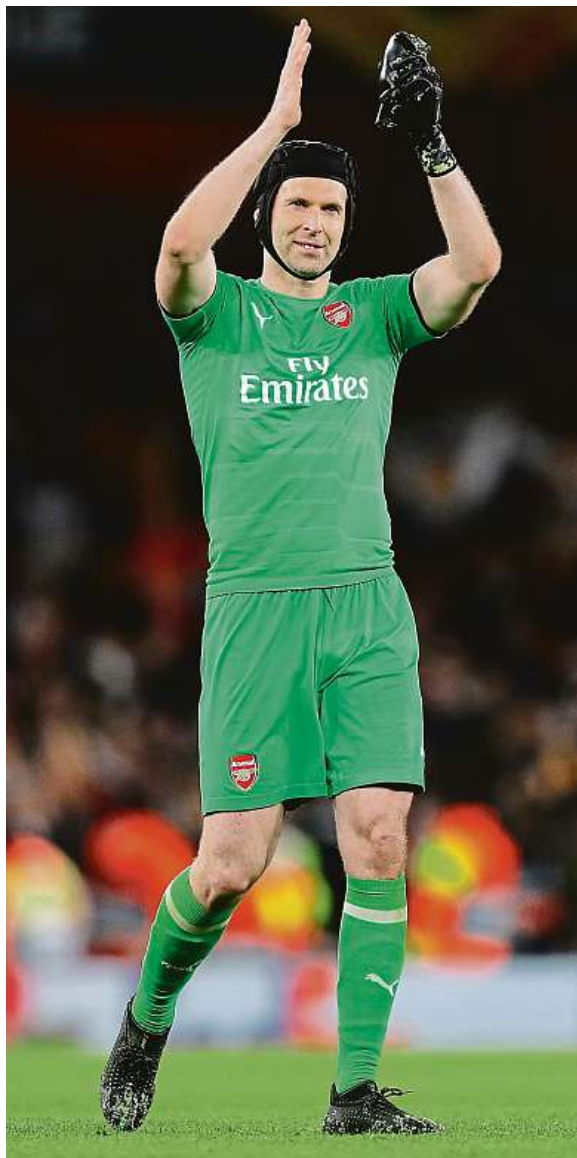
Petr Čech před týdnem po výhře 3:1 nad Valencií

Arsenal v Premier League čtyřikrát za sebou nezvítězil a prakticky ztratil šanci na první čtyřku, zaručující účast v Lize mistrů. Do prestižní soutěže se však může kvalifikovat triumfem v Evropské lize. Londýňané v úvodním zápase s Valencií brzy prohrávali, ale pak skóre třemi góly otočili. V odvetě je čeká těžká práce, neboť španělský soupeř v posledních osmi domácích zápasech Evropské ligy zvítězil. čtk