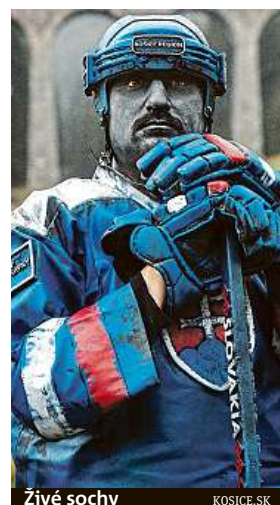
Živé sochy KOSICE.SK