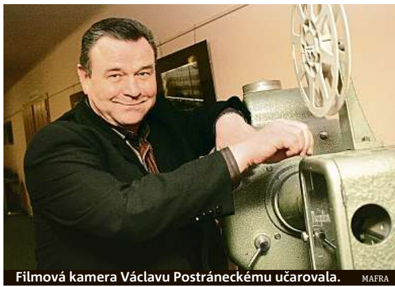
Filmová kamera Václavu Postráneckému učarovala.

Medicína není všemocná. Nestačila na těžkou nemoc, které v úterý večer podlehl herec Václav Postránecký.