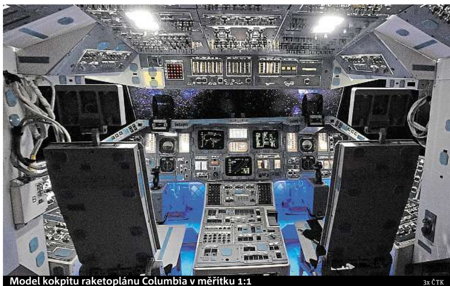
Model kokpitu raketoplánu Columbia v měřítku 1:1