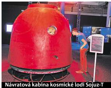
Návratová kabina kosmické lodi Sojuz-T

kterým si mohou návštěvníci projít a zjistit, jak se cítí kosmonauti ve vesmíru,“ uvedl ředitel produkce pořádatel agentury Petr Suchánek. Podobný zážitek skýtá i model kokpitu raketoplánu Columbia. Jedním z lákadel výstavy je kámen z Marsu. Návštěvníci také zjistí, co si kosmonauti oblékají, jak řeší hygienu a jaká další úskalí přináší pobyt ve vesmíru. Výsadkový modul Apollo 11 včetně vnitřního vybavení možná překvapí tím, jak je malý a na pohled křehký. Hrdiny misi Apollo dělilo od kosmického prostoru jen několik centimetrů kovové slitiny a měli k dispozici počítače o výkonu dnešních kalkulaček. Přesto se jim podařilo přistát na Měsíci, splnit tam náročné výzkumné úkoly a poté se v pořádku vrátit zpět. Nenápadným, avšak důležitým exponátem je staré francouzské vydání jedné z knih Julesa Verne. ČTK