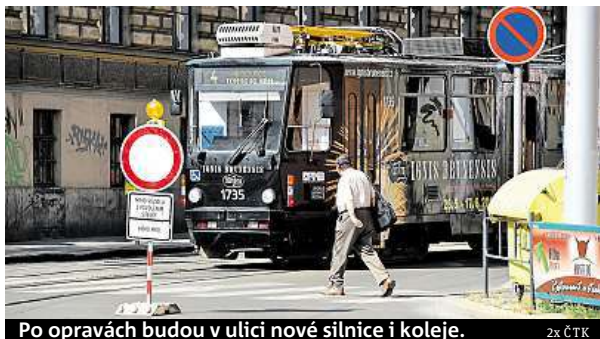
Po opravách budou v ulici nové silnice i koleje.

Na Údolní se budou opravovat veškeré inženýrské sítě v podzemí, poté se udělá nová silnice a tramvajová trať. Až oprava skončí, bude pokračo-