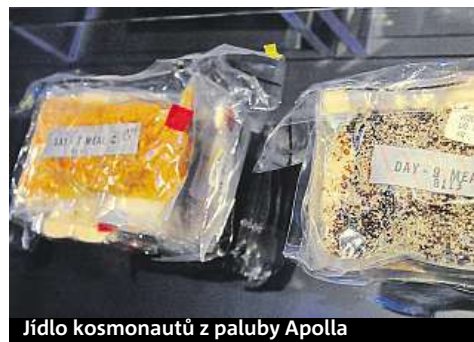
Jídlo kosmonautů z paluby Apollo