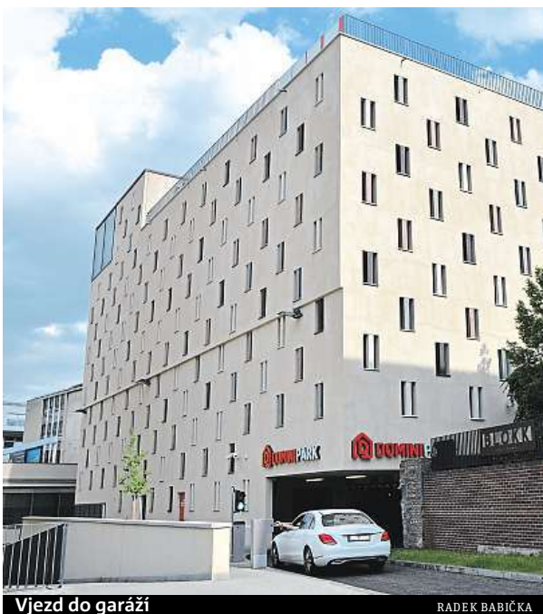
Vjezd do garáže