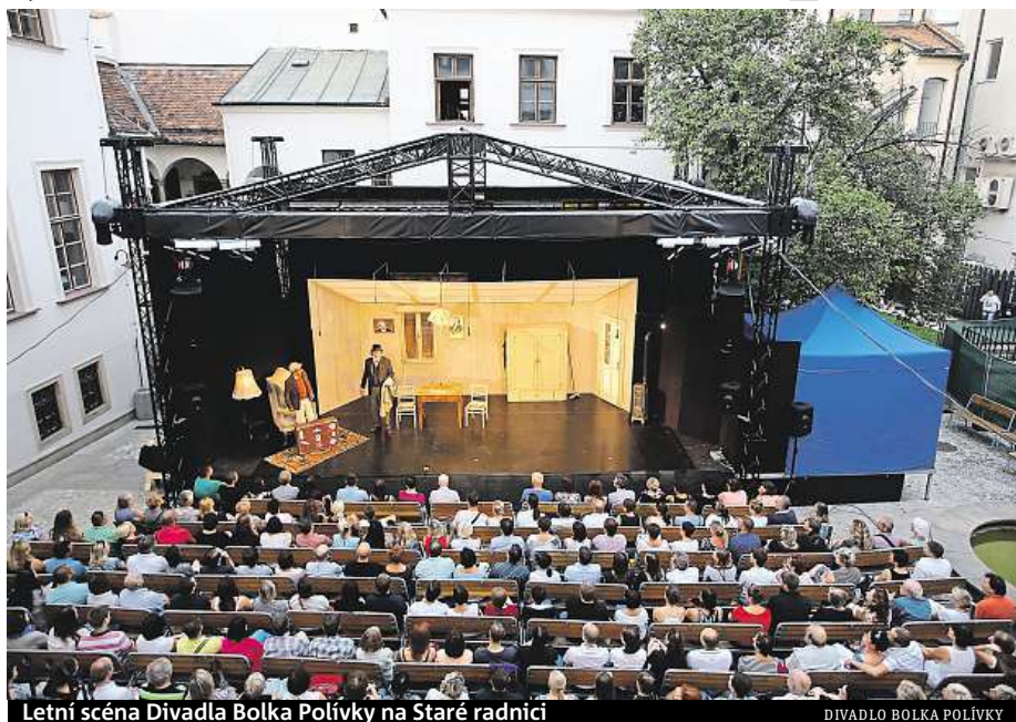
Letní scéna Divadla Bolka Polívky na Staré radnici

Na Staré radnici mohou lidé vidět i dnes již legendární představení Caveman o rozdílném pohledu na svět u mužů a žen. RADEK BABIČKA