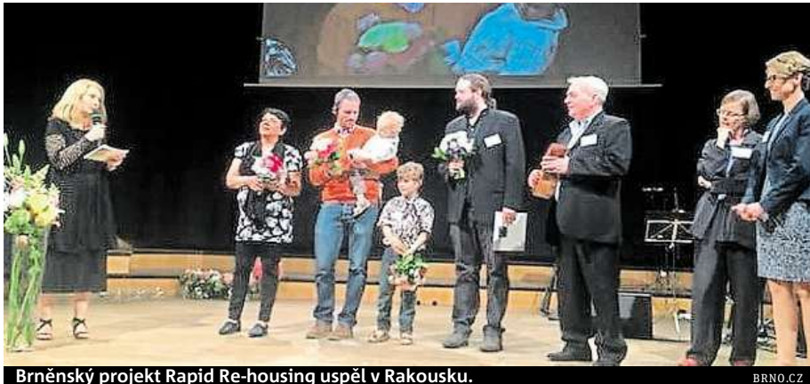
Brněnský projekt Rapid Re-housing uspěl v Rakousku.

Ocenění dostala Platforma pro sociální bydlení a projekt Housing first. „Projekt Rapid Re-housing představujeme na zahraničních fórech jako