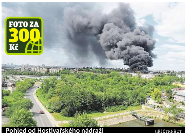
Pohled od Hostivařského nádraží

Požár vypukl kolem 13. hodiny, v hale byl podle Kavky nejspíš uskladněn molitan nebo pneumatiky. Kouř z ohně byl vidět na kilometry daleko. Hasiči zasahovali