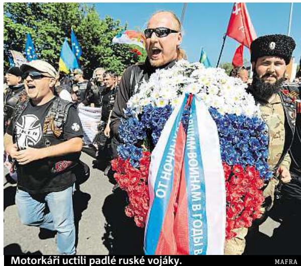
Motorkáři uctili padlé ruské vojáky.

Policisté sice oddělili obě skupiny páskou i auty, ale někteří z demonstrantů se pokusili dostat blíže k sympatizantům Nočních vlků. Policisté jednoho z nich zadrželi. „Policisté zajistili na Olšanských hřbitovech čtyřiačtyřicetiletého muže, který je podezřelý z přestupku proti veřejnému