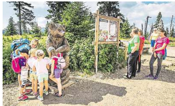
Projít se můžete po naučných stezkách. SKIAREÁL ŠPINDLERŮV MLÝN

„Neustále se snažíme letní aktivity ve Špindlu rozšiřovat, na své si u nás přijdou dospělí i děti. Rodinám rozhodně doporučuji navštívit naše unikátní dětská hřiště u hor-