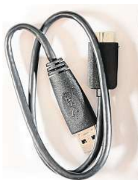
Externí disk Samsung MAXTOR M3 Portable

Tím ale výhody disku zdaleka nekončí. Připojit ho můžete například i k televizi nebo jinému multimediálnímu zařízení a následně přehrávat svou oblíbenou hudbu a fil-