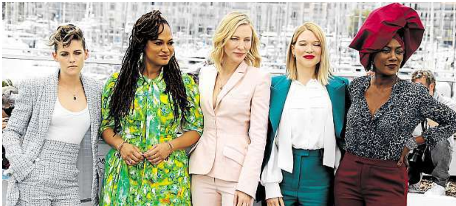
Zleva: Kristen Stewart, Ava DuVernay, Cate Blanchett, Lea Seydoux, Khadja Nin v Cannes

O Zlatou palmu budou letos soupeřit tři režisérky a 18 režisérů; v historii Cannes zatím získala Palmu jen jedna