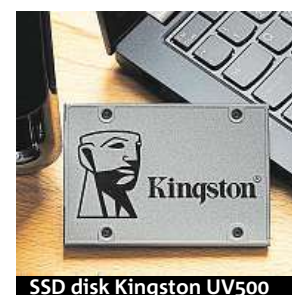
SSD disk Kingston UV500

Disk Kingston UV500 si můžete pořídit třeba v největším českém IT e-shopu Mironet za cenu 1112 korun.