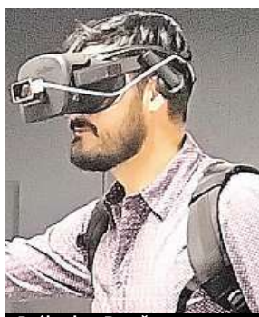
Brýle do 3D světa METRO