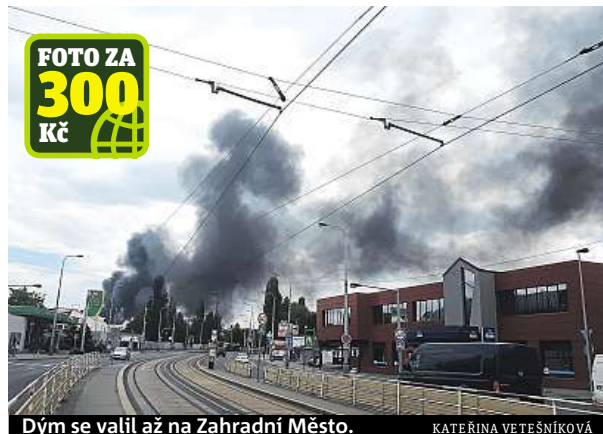
Dým se valil až na Zahradní Město.