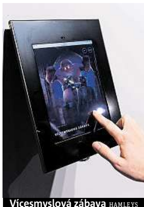
Vícesmyslová zábava HAMLEYS

Pokud budeme úspěšní, možná nás na konci naší dvacetiminutové pouti čeká nejen zdárné dosažení cíle, ale také dobrodružství, jaké