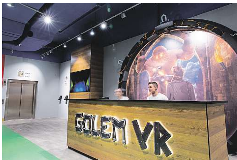
Takto to vypadá hned po vstupu do virtuálního světa.

„Nejde nám o přehnanou historickou přesnost. Je to pořád především zábava. Virtuální realita v takovémto měřítku dosud v Česku nebyla a těšíme se proto, jak budou první návštěvníci na tento zážitek reagovat,“ doplňuje Bacho. FILIP JAROŠEVSKÝ