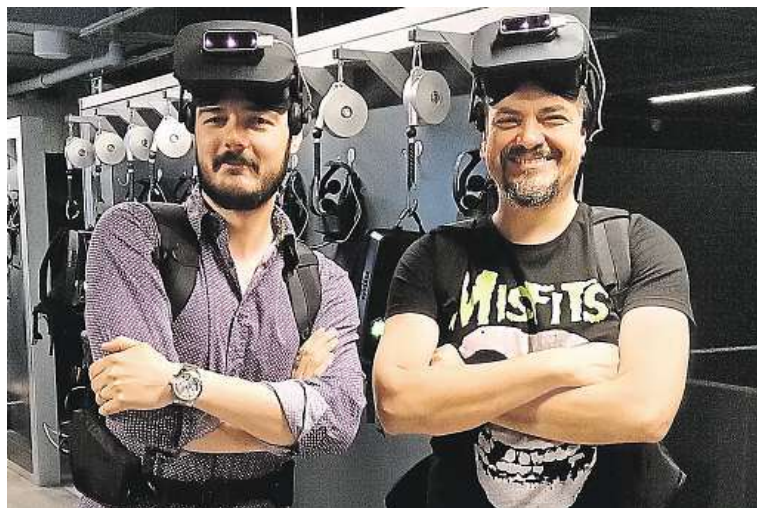
Tým deníku Metro, který se vydal po stopách Golema.