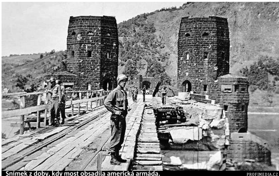
Snímek z doby, kdy most obsadila americká armáda.

Stavby k prodeji stojí na pravém břehu řeky a nabízejí více než 450 čtverečních metrů užité plochy. ČTK