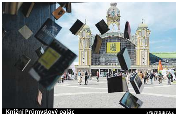
Knižní Průmyslový palác