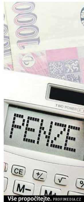
Vše propočítejte.

Penzijní připojištění se státním příspěvkem, takzvaný třetí pilíř penzijního systému, mělo na konci roku 4,47 milionu lidí. Nové smlouvy o penzijním připojištění bylo možné uzavírat do 30. listopadu 2012. Od ledna 2013 lze uzavírat jen smlouvy o doplňkovém penzijním spoření. Nové fondy už neručí za to, aby případný předek nevyšší zhodnocení. Lidé se mohou prostřednictvím fondů připojistit za finančního příspěvní státu od roku 1994. ČTK