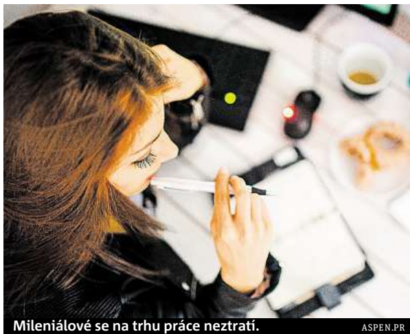
Mileniálové se na trhu práce neztráčí.

Analýza českých mileniálů vychází z údajů platového portálu Platy.cz. Generaci Y rozděluje na dvě skupiny: mladší narozené v letech 1991 až 2000 a starší v období 1980 až 1990. V první skupině jde převážně o lidi vstupující na pracovní trh, v druhé jsou