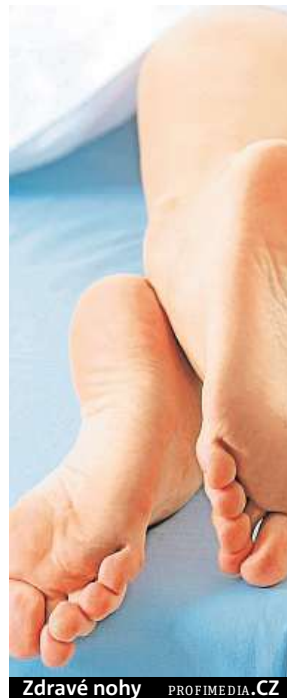
Zdravé nohy

V lékárně najdete také volně dostupné přípravky na odstranění plísní, odborníci ovšem radí obrátit se nejprve na lékaře, který doporučí vhodnou léčbu. „Někdy pomůže vyměnit uzavřenou obuv za vzdušnou. Ve většině případů doporučuji navštívit kožního lékaře,“ doplňuje Kravciv. KAMILA HUDEČKOVÁ