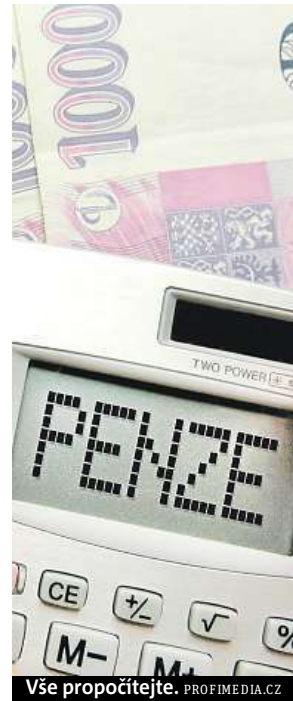
Vše propočítejte.

Penzijní připojištění se státním příspěvkem, takzvaný třetí pilíř penzijního systému, mělo na konci roku 4,47 milionu lidí. Nové smlouvy o penzijním připojištění bylo možné uzavírat do 30. listopadu 2012. Od ledna 2013 lze uzavírat jen smlouvy o doplňkovém penzijním spoření. Nové fondy už neručí za to, aby případný předek nevyšší zhodnocení. Lidé se mohou prostřednictvím fondů připojistit za finančního příspěvní státu od roku 1994. ČTK