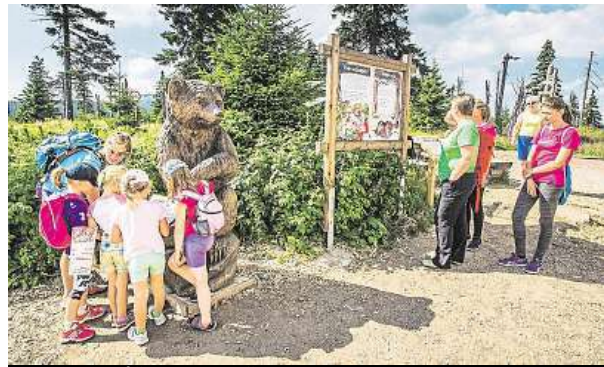
Projít se můžete po naučných stezkách. SKIAREÁL ŠPINDLERŮV MLÝN

„Neustále se snažíme letní aktivity ve Špindlu rozšiřovat, na své si u nás přijdou dospělí i děti. Rodinám rozhodně doporučuji navštívit naše unikátní dětská hřiště u hor-