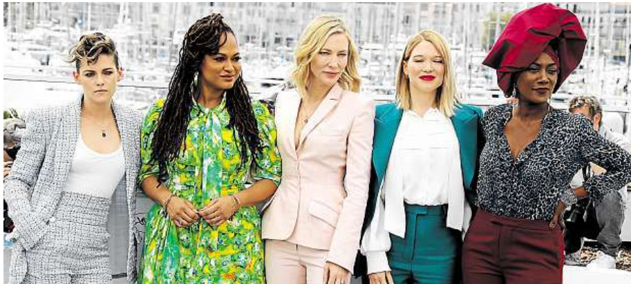
Zleva: Kristen Stewart, Ava Duvernay, Cate Blanchett, Lea Seydoux, Khadja Nin v Cannes

O Zlatou palmu budou letos soupeřit tři režisérky a 18 režisérů; v historii Cannes zatím získala Palmu jen jedna