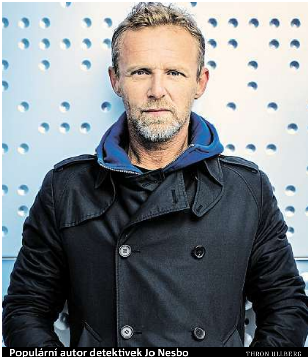
Populární autor detektivek Jo Nesbo

Celosvětově se prodalo přes 30 milionů vašich knih. Představoval jste si, že vás bude číst tolik lidí?