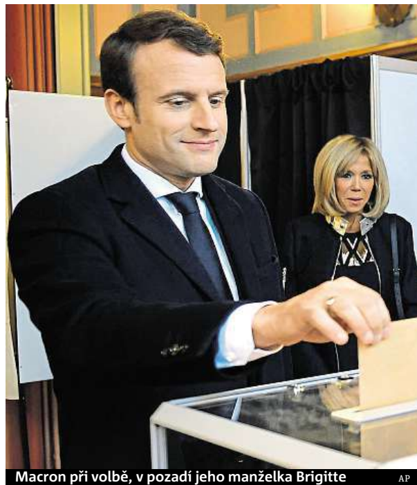
Macron při volbě, v pozadí jeho manželka Brigitte