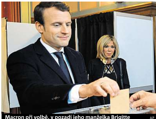
Macron při volbě, v pozadí jeho manželka Brigitte

Jako jedna z prvních přišla gratulace od německé kancléřky Angely Merkelové, které Macron následně po telefonu sdělil, že brzy zavítá do Berlína. Britská premiérka Theresa Mayová a americký prezident Donald Trump uvedli, že se těší na spolupráci s nově zvoleným prezidentem. Velmi