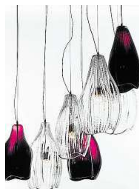
Vystavuje i sklář Bejvl. FB

Návštěvníci si také budou moci prohlédnout retrospektivní výstavu váz Jaroslava