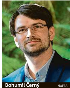
Bohumil Černý MAFRA