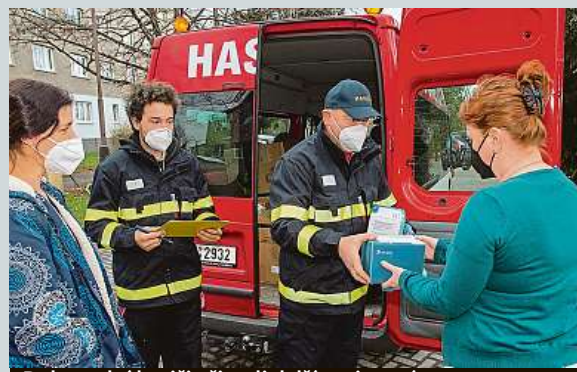
Dobrovolní hasiči přivezli další antigenní testy. ČTK

Výzkumníci Univerzity Pardubice vyvinuli test, který pozná onemocnění podle poruch chuti. Lidé by se jím mohli sami testovat. Ztráta chuti i čichu je vedlejším projevem některých onemocnění včetně covidu-19. ČTK