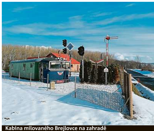
Kabina milovaného Břejlovce na zahradě

Z jejich zahrady se pomalu stává železniční muzeum. Prozatím tu mají staré drážní lampy, cedule a označení návěstidel, drážní telefon, světlá a mechanická návěští, kabinu z trutnovského Břejlovce 750.346-9, služební va-