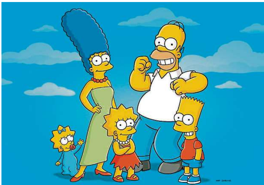
Všechny díly Simpsonových? Museli byste si vzít pár týdnů dovolené.

Společnost Netflix těsně před koncem roku zveřejnila informace o nejsledovanějších pořadech v České republice. Nejvíce sledovaným žánrem byly dramatické a detektivní filmy a seriály. Druhé místo v žebříčku obsadily komedie. Proti roku 2019 znamenala největší skok kategorie fantasy, která narostla šestnáctkrát. Devítinásobně větší zájem byl o romantiku. Často jde o staré „kusy“, na které jste se dívali v mládí. „Naše paměť je selektivní a má tendenci si idealizovat vše, co bylo dříve. Návrat ke starým filmům nám tuto iluzi ztraceného ráje posílá a my se na chvíli cítíme opět v bezpečí, v časech, které nám připadaly klidné a srozumitelné,“ říká psycholog a psychoterapeut Daniel Štrobl.