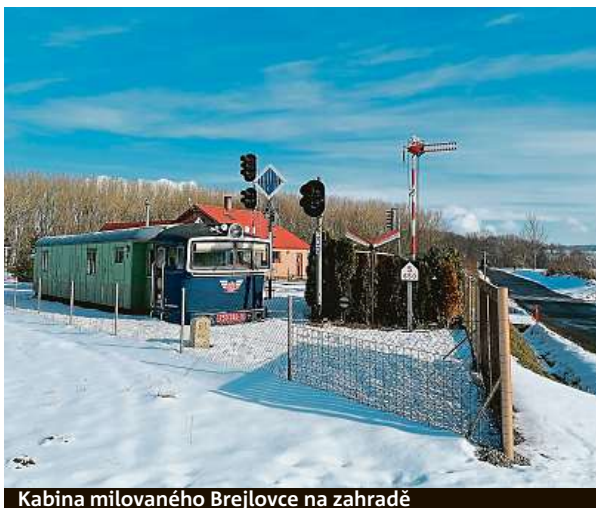
Kabina milovaného Břejlavce na zahradě

Z jejich zahrady se pomalu stává železniční muzeum. Prozatím tu mají staré drážní lampy, cedule a označení návěstidel, drážní telefon, světlá a mechanická návěští, kabinu z trutnovského Břejlavce 750.346-9, služební va-