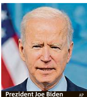
Prezident Joe Biden

Prezident Joe Biden oznámil plán federální injekce ve výši 2,3 bilionu dolarů (44,1 bilionu korun). „Je to největší investice do Ameriky od druhé světové války,“ pronesl Biden na setkání v Pittsburghu.