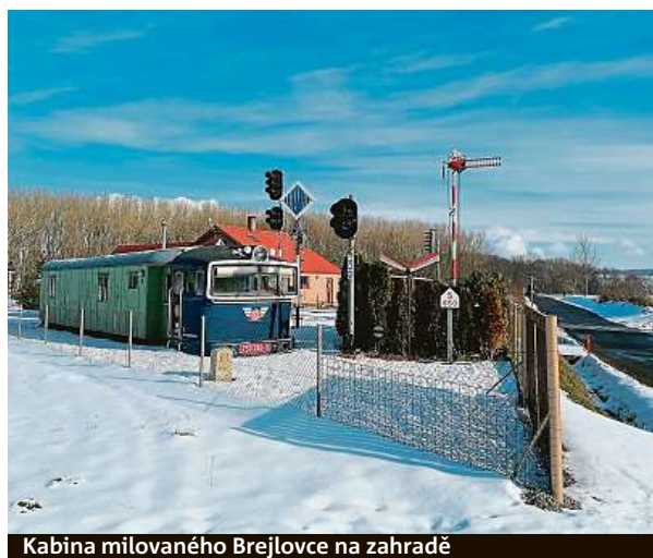
Kabina milovaného Břejlavce na zahradě

Z jejich zahrady se pomalu stává železniční muzeum. Prozatím tu mají staré drážní lampy, cedule a označení návěstidel, drážní telefon, světlá a mechanická návěští, kabinu z trutnovského Břejlavce 750.346-9, služební va-