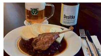
Čtvrtka pečené kačeny se zelím