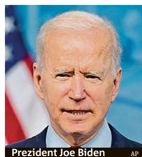
Prezident Joe Biden

Šéf Bílého domu svůj program prospíkoval narážkami na vesmírný program Johna F. Kennedyho či tažení proti chudobě a rasové nerovnosti, které určovalo domácí politiku koncem 60. let. Podle komentátorů ale důraz na obnovu infrastruktury ze všeho nejvíce evokuje program Nový úděl, jímž prezident Franklin D. Roosevelt v 30. letech vyvedl USA z Velké hospodářské krize. „Nový úděl byl ještě gigantičtější, nicméně i tak Bidenův návrh bere dech,“ napsal komentátor The Washington Post Fareed Zakaria.