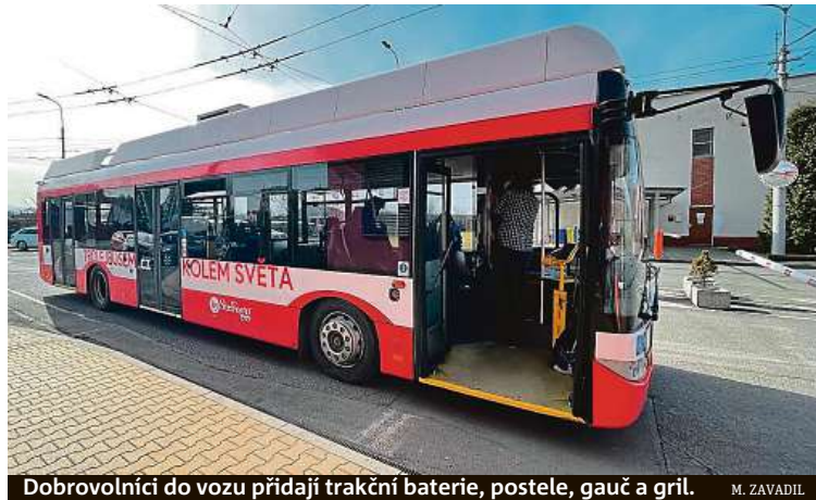
Dobrovolníci do vozu přidají trakční baterie, postele, gauč a gril.