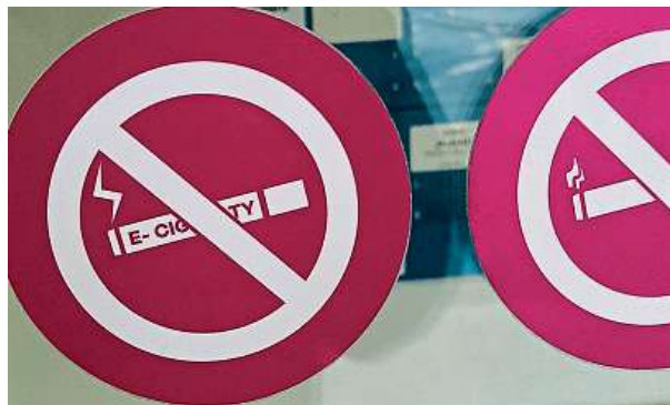
Na vstupních dveřích polikliniky je i zákaz e-cigaret.

Zařízení typu Iqos nebo takzvané vaporizéry zákon v restauracích nezakazuje. Pravidla si obvykle určuje obsluha.