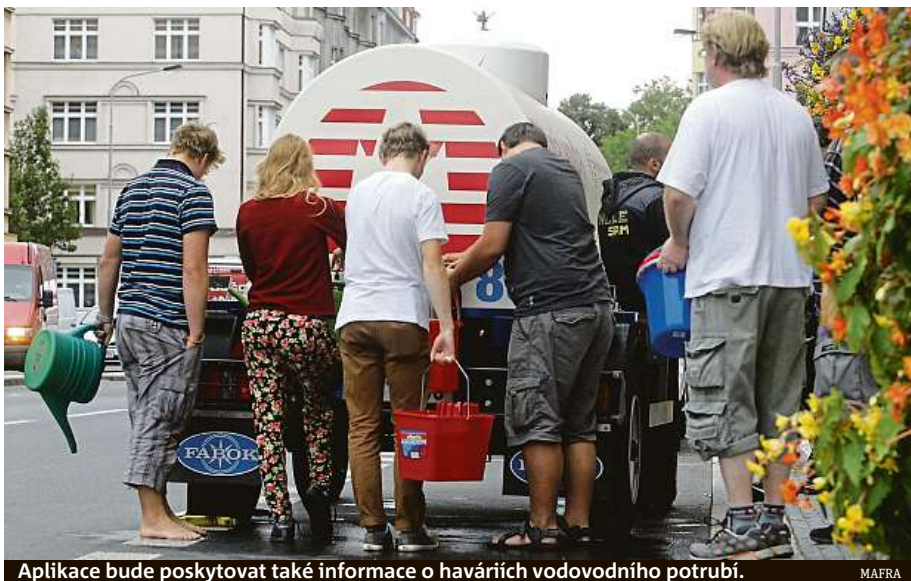
Aplikace bude poskytovat také informace o haváriích vodovodního potrubí.

„Hlavním produktem je informovaný a aktivně zapojený občan. Platforma nabízí uživatelům informace z města, kde žijí. Ty chodí vhodnou formou. Pokud je něco urgentní, přijde to prostřednictvím SMS, pokud vizuálně obsáhlejší, pak jako e-mail nebo do aplikace,“ upřesňuje Ivan