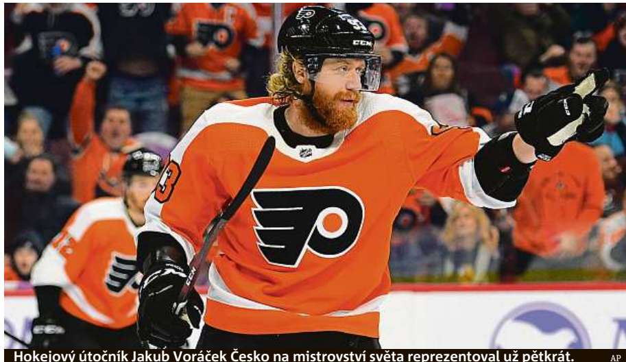
Hokejový útočník Jakub Voráček Česko na mistrovství světa reprezentoval už pětkrát.