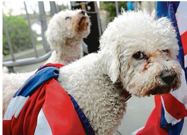
Pes potřebuje mít v jídle dostatek živočišných bílkovin.

„Lidé si velmi často mylně domnívají, že psi mají alergie na granule jako celek. Ve skutečnosti se ale jedná o alergie na určitou složku, která je v granulích obsažená, napří-