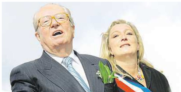
Le Penovi v roce 2004 ještě na společné lodi

Marine Le Penová včera zablokovala otcovu kandidaturu v letošních regionálních volbách kvůli neshodám kolem směřování této protiimigrantické strany a kvůli nedávnému otcovu kontroverznímu rozhovoru pro týdeník Rivarol, který má blízko k neonacistickým tezím. Otec Jean-Marie Le Pen v rozsáhlém rozhovoru,