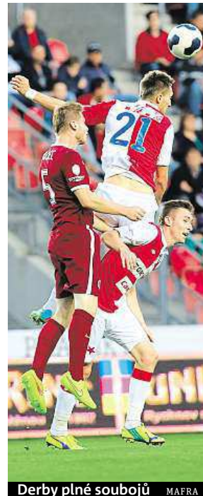
Derby plné soubojů