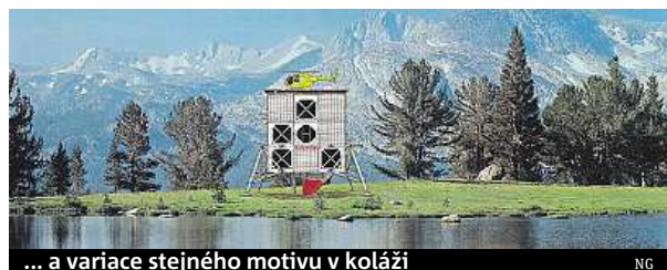
... a variace stejného motivu v koláži