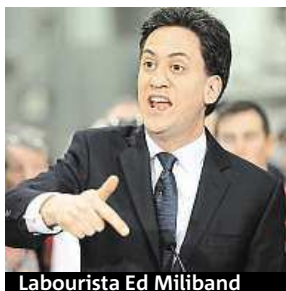
Labourista Ed Miliband