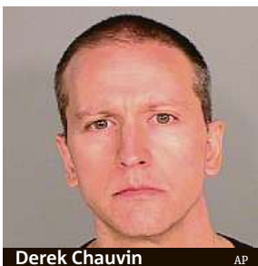
Derek Chauvin