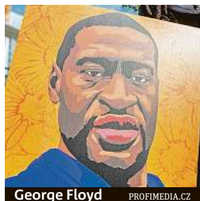
George Floyd

Čtyřiařtyřicetiletý Chauvin nyní čelí obvinění z vraždy druhého stupně. Hrozí mu až 40 let za mřížemi.