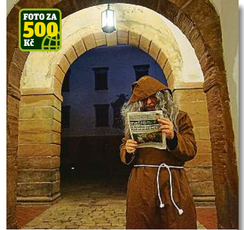
Čtenář, který chtěl zůstat v anonymitě, se sice od Prahy trochu vzdálil, ale i tak mu náleží odměna 500 korun. Na zámku v Kostelci nad Černými lesy vyfotil tajemného řeholníka. A asi i po zákazu vycházení...