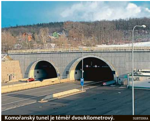
Komořanský tunel je téměř dvoukilometrový.

Kvůli plánovaným pracím bude nutné tunely pro řidiče postupně uzavírat. Podle Beneše se nic bližšího k harmononce zatím neví. Jisté je jen to, že práce budou probíhat o víkendech od června do listopadu. „V současnosti se projednávají dopravní inženýrská opatření, která musí