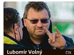
Lubomír Volný

pomocí úmrtí (tedy vraždy) několika pacientů, kteří jej budou užívat“. Kvůli možným vraždám si poslance předvolává policie. Ta připomíná, že každý, kdo se dozví o přípravě vraždy, to musí oznámit policii. V opačném případě se sám trestného činu dopouští. IDNES.cz