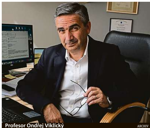
Profesor Ondřej Víklický

Většina nemocných po prodělaném onemocnění covid-19 poškození ledvin nemá. V případě závažné infekce ale ledviny mohou být v souvislosti s covidem-19 poškozené a nemocní by tuto informaci měli získat při propuštění z nemocnice. Pokud nejsou přítomna předchozí onemocnění ledvin, stačí jenom jejich stav sledovat při kontrolním vyšetření u praktického lékaře. Ten rozhodne, zda je nutné další vyšetření u nefrologa. Ledvinám určitě pomůže při rekonvalescenci normální – tedy nikoliv malý příjem tekutin, delší klidový režim a vyloučení užívání takových léků, které mohou ledviny poškodit.