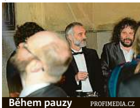
Během pauzy

„Pražská policie prověřuje, zda někteří z účastníků sobotního vyhlášení filmových cen Český lev neporušili vládní nařízení vyhlášená kvůli koronavirové pandemii,“ uvedl ministr vnitra Jan Hamáček. Na sociálních sítích se po skončení ceremoniálu v pražském Rudolfinu objevily fotografie, na kterých umělci postávají v těsných hloučcích kolem stolků před budovou, kouří a povídají si. Nemají na sobě respirátory ani nanoroušky. Na ceremoniálu platila přísná opatření. Všichni, kdo se večera v Rudolfinu chtěli zúčastnit, museli podstoupit PCR test na covid-19