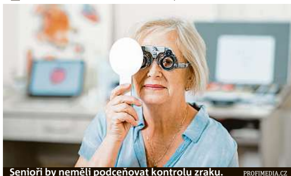
Senioři by neměli podceňovat kontrolu zraku.

Jak vyplynulo z průzkumu agentury STEM/MARK pro oční kliniku NeoVize, dvě třetiny seniorů mají aktuální problémy s viděním. Přesto více než čtvrtina lidí nad 65 let o svůj zrak dostatečně nepečuje – očního lékaře v posledním roce nenavštívilo 28 procent z nich. Přitom zrak je nejdůležitějším smyslovým orgánem, kterým vnímáme až 80 procent podnětů v okolí.