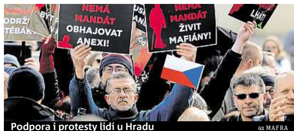
Podpora i protesty lidí u Hradu