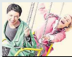
Tátova volha CINEMART

O víkendu můžete vyrazit na nový film Tátova volha. V hlavních rolích se opět spolu představí oblíbené