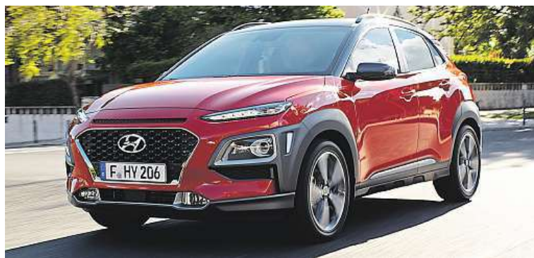
K testovacím jízdám bude připraven i atraktivní model Hyundai Kona. HYUNDAI

Dealerství Hyundai v pražských Butovicích připravilo v rámci oslav Mezinárodního dne žen na zítra den otevřených dveří. Přijďte se svou maminkou, manželkou nebo třeba i dcerou vyzkoušet, případně i vybrat dárek v podobě vozu Hyundai.