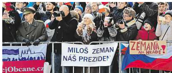
Podpora i protesty lidí u Hradu