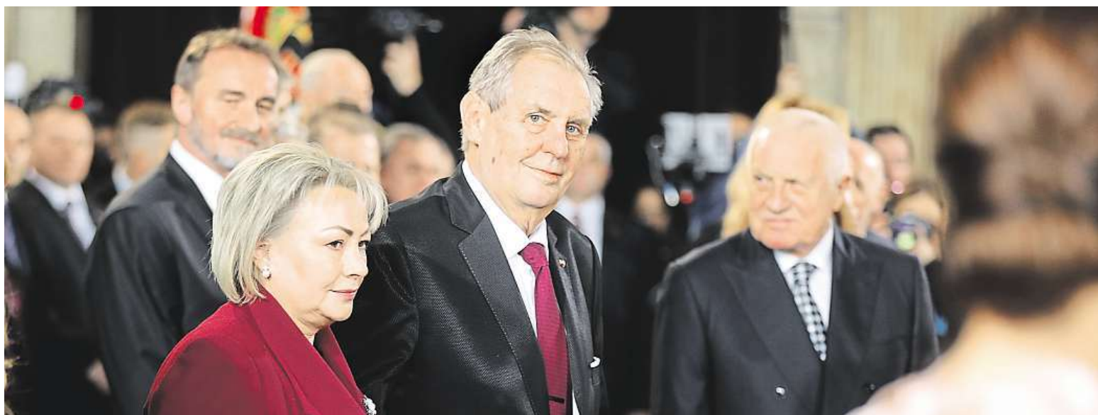
Zeman po slibu zamířil do svatovítské katedrály uctít památku svatého Václava. Venku protestovali jeho odpůrci, o kus dál se sešli jeho příznivci.

Skandál při inauguraci. Prezident kritizoval novináře, část poslanců na protest odešla z Vladislavského sálu. Dalších pět let. Zeman sice při ceremoniálu nepoložil ruku na výtisk ústavy, ale slib platí STRANA 5