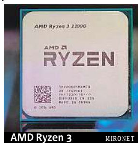
AMD Ryzen 3 MIRONET

ních jednotek architektury RX VEGA s maximální frekvencí 1100 MHz. Zmínit musíme i rychlý paměťový řadič, který podporuje paměti o rychlosti až 2933 MHz. Jak už navíc bývá u AMD zvykem, i nové Raven Ridge APU jsou odemčené pro přetaktování, jehož potenciál je oproti první generaci ryzenů znatelně vyšší.