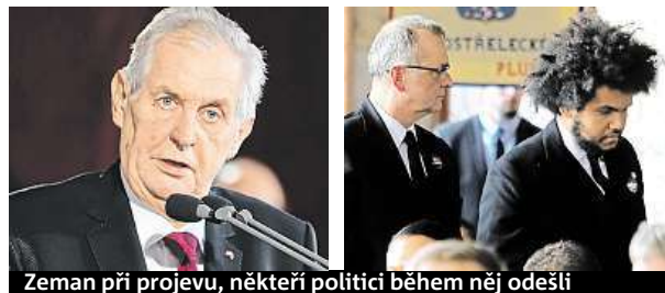
Zeman při projevu, někteří politici během něj odešli