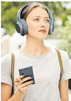
Sony Xperia XZ1 MIRONET

Sony jako jediný z velkých výrobců nedělá rozdíly mezi