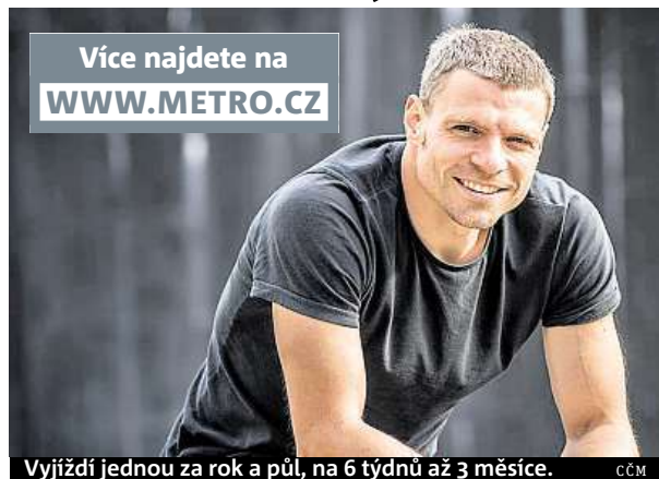
Vyjíždí jednou za rok a půl, na 6 týdnů až 3 měsíce. ČČM

Co se týče chirurgů, anesteziologů a dalších velmi exponovaných specializací, služba vlastně nikdy nekončí, protože pracují v rytmu 24/7. Pokud nastane stav nouze, musíme být k dispozici. Ráno vstávám třeba v 6.30, snažím se odbavit nějaké e-maily, proto-