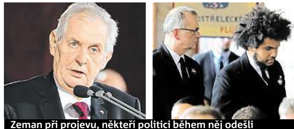
Zeman při projevu, někteří politici během něj odešli