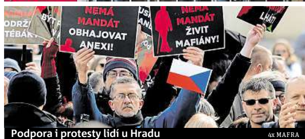
Podpora i protesty lidí u Hradu