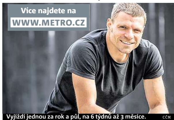
Vyjíždí jednou za rok a půl, na 6 týdnů až 3 měsíce. ČČM

Je pravda, že po pěti misích, které už mám za sebou, si mohu vybrat kontinent, na který se vydám, ale nikoli konkrétní zemi. Jižní Súdán