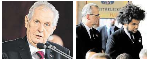
Zeman při projevu, někteří politici během něj odešli