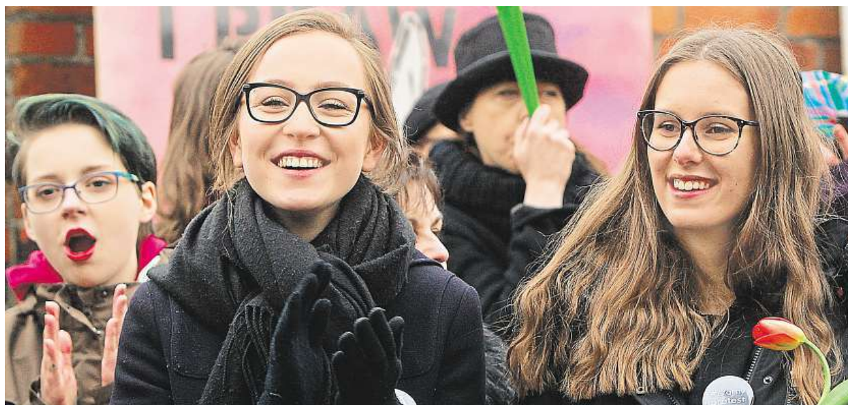
Svět si připomněl Mezinárodní den žen. Do ulic Varšavy vyšly i mladé Polky, které se dožadovaly respektu.

Za 50 milionů. Staroměstská radnice projde největší rekonstrukcí od 2. světové války, na etapy má probíhat dva roky. Bezpečí. Na ochozu věže přibude plot. Opraví se i orloj. Vráti mu podobu z 80. let 19. století STRANA 3