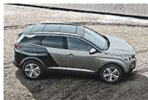
Auto roku 2017

Peugeot 3008 byl v pondělí zvolen Autem roku 2017. Porota, v níž zasedlo 58 novinářů z celé Evropy, ocenila jeho styl, design interiéru a funkce. Toto ocenění doplňuje zhruba dvacítku cen, které nový Peugeot 3008 již získal. Jde o první oceněné SUV v historii soutěže Car of the Year a pátý vůz značky Peugeot, který tuto cenu získal. Jeho cílem je prosadit se jako důležitý zástupce segmentu kompaktních SUV. Peugeot i-Cockpit® nejnovější generace představuje nový přístup k místu řidiče. Nabízí intuitivnější zážitek z řízení vůz značným kompaktním volantem, vyšším přístrojovým panelem s 12,3" obrazovkou a centrálním displejem s kapacitní technologií s ergonomickými „klávirními klávesami“. Nový Peugeot 3008 nabízí rovněž high-tech výbavu, řadu podpůrných prvků řízení a nepřetržitou konektivitu. V Evropě si ho objednalo již téměř sto tisíc zákazníků. V 84 procentech si zvolili stupně výbavy Allure, GT Line nebo GT, což přispělo k přesunu značky k luxusnějším kategoriím vozů. Vůz se vyrábí v Sochaux a má nárok na označení Origine France garantie (Záruka francouzského původu). MET