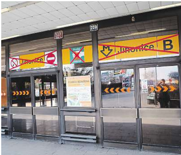
Stanice se uzavřela poprvé od otevření v roce 1988. 2x METRO

Sedmiměsíční rekonstrukce stanice, kterou si vyžádaly hlavně masivní průsaky vody, ovlivnila nejen místní podnikatele, ale také starší obyvatele Prahy 5. Věra Kotíková, která bydlí hned vedle zastávky Jinonice, v ulici Puchmajerova, tak musí při svých pravi-