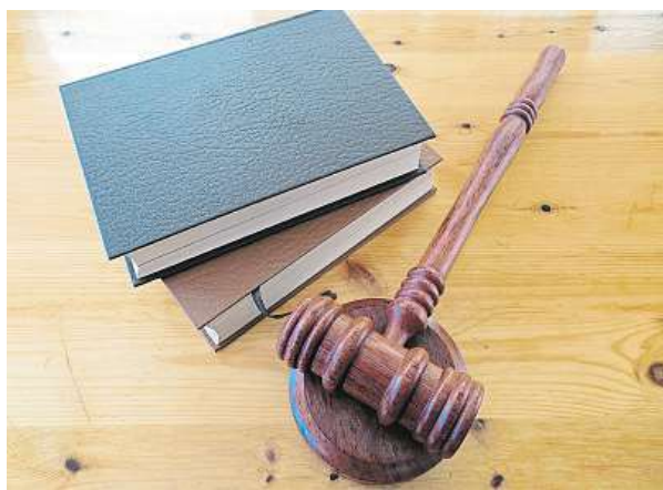
Studenti získávají na magistrátu potřebnou praxi.

„Jsem ráda, že se podařilo navázat tuto spolupráci. Je to velmi výhodné pro obě strany. Jak pro studenty, kteří tak získají cennou praxi, tak i pro obyvatele Prahy, kteří si nevědí rady s nějakou situací právního charakteru. Právní poradnu považují za přínosný projekt. Doufám, že tato spolupráce bude mít dlouhé