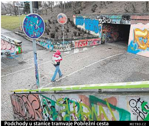
Podchody u stanice tramvaje Pobřežní cesta