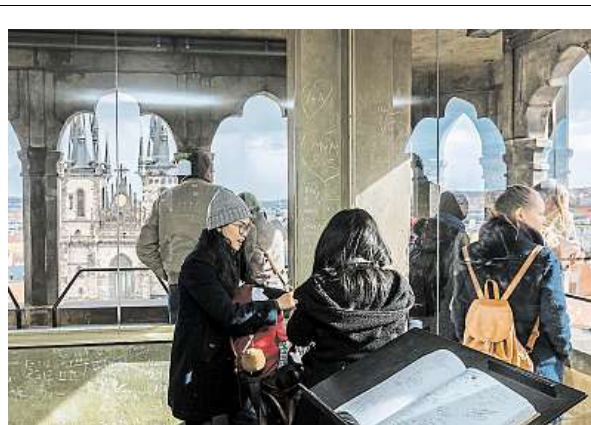
Staroměstskou radnici navštíví denně zhruba tři tisíce lidí.