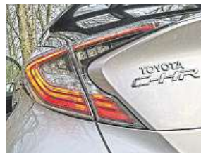
Neobvyklé tvary nové Toyoty C-HR budí emoce.