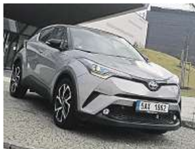
Neobvyklé tvary nové Toyoty C-HR budí emoce.