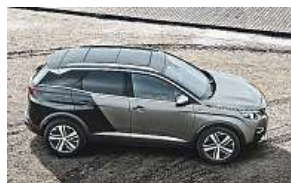
Auto roku 2017

Peugeot 3008 byl v pondělí zvolen Autem roku 2017. Porota, v níž zasedlo 58 novinářů z celé Evropy, ocenila jeho styl, design interiéru a funkce. Toto ocenění doplňuje zhruba dvacítku cen, které nový Peugeot 3008 již získal. Jde o první oceněné SUV v historii soutěže Car of the Year a pátý vůz značky Peugeot, který tuto cenu získal. Jeho cílem je prosadit se jako důležitý zástupce segmentu kompaktních SUV. Peugeot i-Cockpit® nejnovější generace představuje nový přístup k místu řidiče. Nabízí intuitivnější zážitek z řízení pomocí nového kompaktního volantu, vyšším přístrojovým panelem s 12,3" obrazovkou a centrálním displejem s kapacitní technologií s ergonomickými „klávirními klávesami“. Nový Peugeot 3008 nabízí rovněž high-tech výbavu, řadu podpůrných prvků řízení a nepřetržitou konektivitu. V Evropě si ho objednalo již téměř sto tisíc zákazníků. V 84 procentech si zvolili stupně výbavy Allure, GT Line nebo GT, což přispělo k přesunu značky k luxusnějším kategoriím vozů. Vůz se vyrábí v Sochaux a má nárok na označení Origine France garantie (Záruka francouzského původu). MET