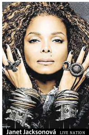
Janet Jacksonová

Janet Jacksonová odkládá turné včetně pražského koncertu. Také zpěvák skupiny AC/DC má zdravotní komplikace.