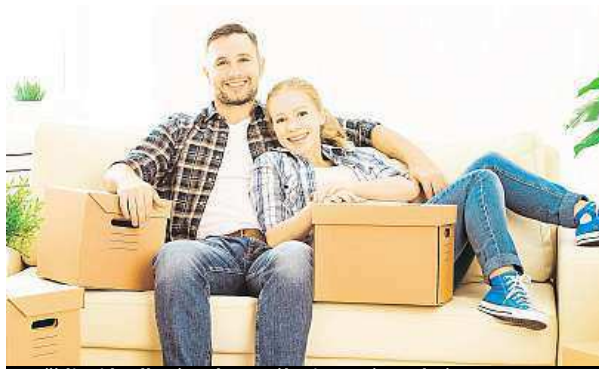
Pořídit si bydlení na hypotéku je nyní snadné.

Při rozhodování vzít si hypotéku si ale dobře prostudujte nabídky bank či stavebních spořitelen a také zvažte, na jak dlouho se zadlužíte. Splátky si můžete rozložit až na třicet let. Dobře je také vhodně zvolit fixační dobu, po kterou budete mít zaruče-