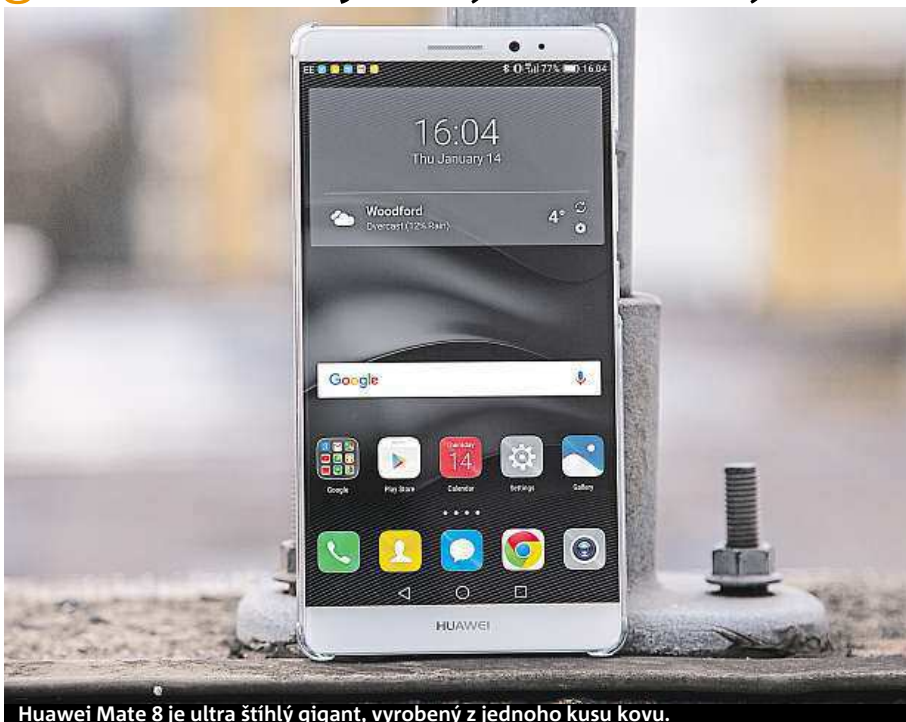
Huawei Mate 8 je ultra štíhlý gigant, vyrobený z jednoho kusu kovu.

Podíváme se teď společně do útroby, v nichž se nachází vskutku prémiové kousky elektroniky. Osm jader procesoru Kirin 950 si hravě poradí se sebenáročnějšími aplikacemi a hrami. Nepřekvapíte ho ani několika naráz spuštěnými procesy, a to i díky velkorysé kapacitě 3 GB operační paměti a optimalizované nadstavbě operačního systému Android 6.0 – EMUI 4.0. Prostor pro ukládání souborů