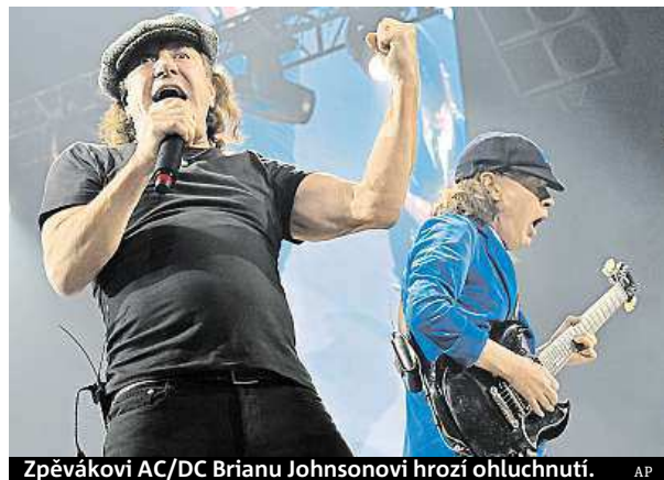
Zpěváci AC/DC Brian Johnsonovi hrozí ohluchnutí.

Rok 2016. Rok, kdy se v Česku měly ukázat známé světové pěvecké hvězdy. Mnoho jich jistě skutečně dorazí, ale dva koncertní zážitky se fanouškům komplikují.