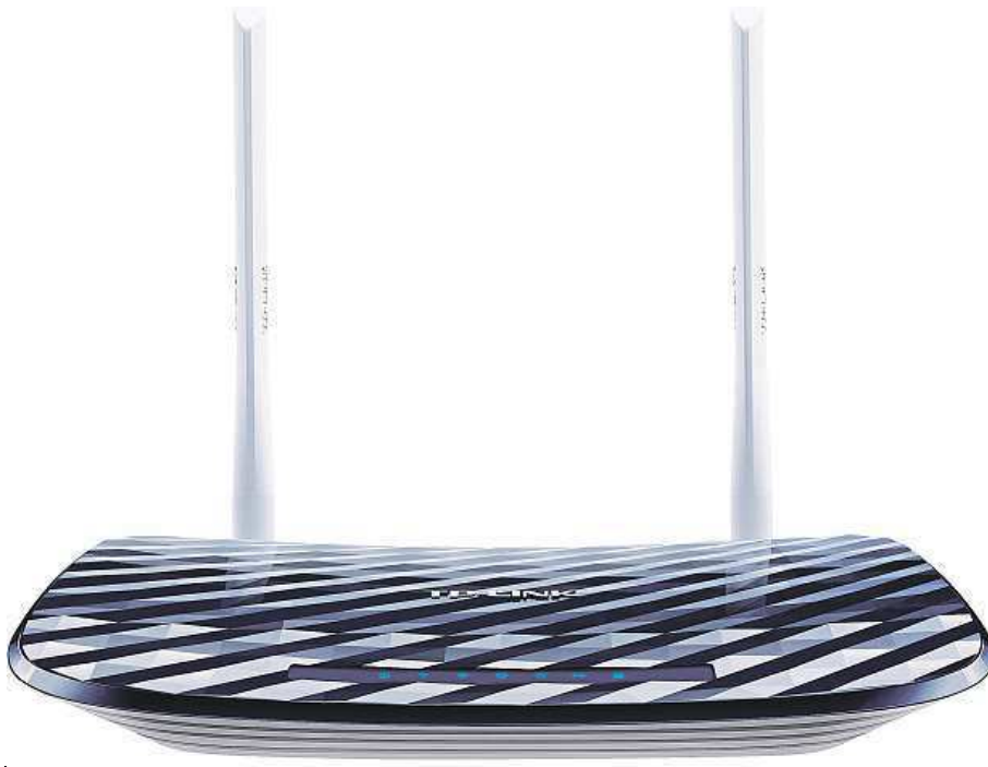
Router C20 dosahuje až třikrát vyšší přenosové rychlosti oproti generaci minulé. 2x MIRONET

Router C20 dokáže pracovat v obou pásmech současně, jednoduché aktivity, jako jsou e-maily či běžné surfová-