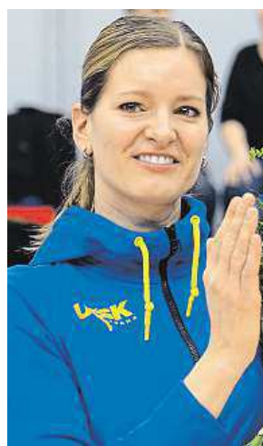
Eva Vítečková ČTK

Překvapivé prvenství si připsal cyklista Zdeněk Štybar na jednorázovém závodě Strade Bianche v Toskánsku, který měřil 200 kilometrů. ČTK