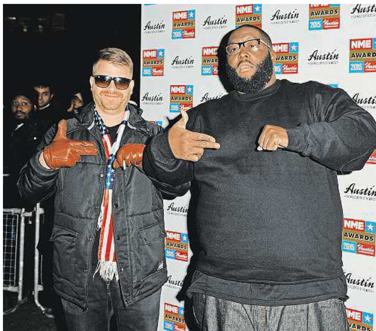
Přijedou také američtí Run The Jewels.