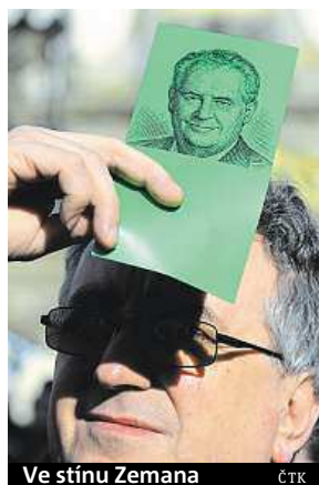
Ve stínu Zemana

Na akci pořadatelé rozdávali placky s nápisem Stojím si za svým prezidentem a symbolické zelené karty rovněž se Zemanovým portrétem jako protiváhu k červeným kartám, které vystavují Zemanovi jeho kritici. Ke shromážděným lidem promluvil vedle dalších řečníků včetně předsedů KSČM Vojtěcha Filipa a Úsvitu Tomia Okamury i Zeman, který krátce předtím položil u pomníku Tomáše Garrigua Masaryka věnec k 165. výročí jeho narození. Akce s pódiem i velkoplošnou obrazovkou trvala zhruba hodinu. Právě o Masarykovi mluvil prezident i před svými příznivci. Připomněl jim