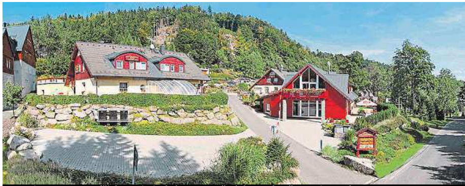
Penzion UKO z Bedřichova je jedním z oceněných v anketě Penzion roku.

Svým charakterem rodinným je také bedřichovský Penzion UKO, který obsadil druhé místo v celkovém žebříčku a první pozici v podkategorii Nejlepší penzion pro rodiny s dětmi. „Tím, že nás mnozí hosté navštěvují opakovaně, nám dávají najevo, že se u nás cítí dobře. A to nás