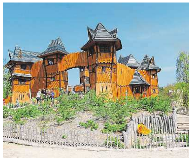
S hezkým počasím můžete vyrazit do Milovic. MIRAKULUM

„Jde o spojení fantaskního designu a originálních technologií. Už na konci června nabídneme soustavu jezírek, kaskád, potůčků, hrází, čerpadel a mnoha dalších vodních