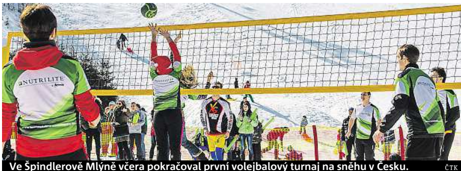
Ve Špindlerově Mlýně včera pokračoval první volejbalový turnaj na sněhu v Česku. ČTK

Z muničního skladu ve Vrbeticích na Zlínsku včera vyrazil druhý konvoj s municí do armádního skladu v Květně na Svitavsku. Munice soukromých firem se z areálu, kde loni vybuchly dva sklady, začala odvážet v sobotu. Včera se na cestu vydalo dalších pět speciálních hasičských kontejnerů naložených výbušným raketovým palivem, doprovázela je policie. Další převozy budou následovat. Ministr vnitra Milan Chovanec v sobotu při návštěvě muničního skladu prohlásil, že vyskladňování bude trvat řadu měsíců až jeden rok. ČTK