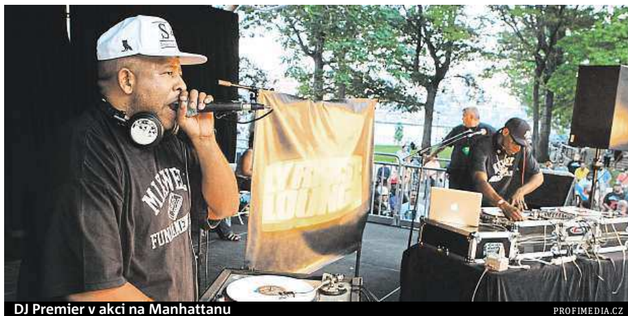
DJ Premier v akci na Manhattanu

Na letošní, už čtrnáctý, Hip Hop Kemp, který se uskuteční od 20. do 22. srpna v hradeckém Festivalparku, dorazí legendární DJ Premier. Producent, který za dva týdny oslaví už 49. narozeniny, při-