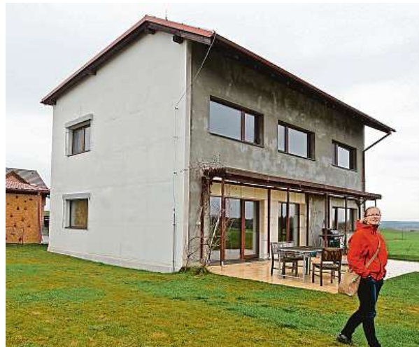
Nízkoenergetické nebo soběstačné domy si nemusíte představovat jako futuristická sídla. Mohou klidně vypadat jako běžná stavba.

Většina bank v Česku, které provozovaly a stále ještě provozují jako dceřiné společnosti stavební spořitelny, s útlumem státního příspěvku na stavební spoření, upravila činnost. „Stavební“ poradci se zaměřují jak na problematiku úvěrů na bydlení, tak i výhodných úvěrů na úsporné bydlení a poradenství v oblasti dotací nejen ve známém programu Zelená nebo Nová