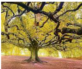
Buk z Bayeux FRANCOIS TRINEL

První týden hlasování v soutěži o Evropský strom roku 2024 uběhl a první Evropané již odevzdali své hlasy. Ke včerejšímu ránu jich bylo téměř 44 tisíc. Organizátoři z Nadace Partnerství díky novým pravidlům soutěže dvakrát obtajni průběžné pořadí. První je tu. Zatím vede francouzský Buk z Bayeux, následovaný polským bukem Srdce zahrady a Tisíciletým olivovníkem z italského Luras. Česká hruška je prozatím čtvrtá. O vítězích mohou zájemci rozhodovat do 20. února, a to na webu Evropskystromroku.cz. MET