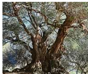
Italský olivovník VALERIO ATZORI