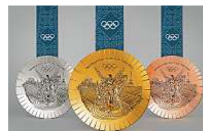
Olympijské medaile pro Paříž

gramové kousky železa pocházejí z dřívějších rekonstrukcí Eiffelovy věže a byly léta uloženy na tajném místě. Pařížská mincovna vyrobí pro hry 5084 medailí. ČTK