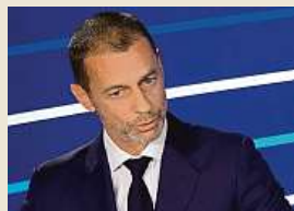
Aleksander Čeferin

Aleksander Čeferin v roce 2027 skončí ve funkci prezidenta evropské fotbalové unie UEFA. Slovinský funkcionář, jenž šéfuje evropskému fotbalu od září roku 2016, to nečekaně oznámil na kongresu UEFA v Paříži.