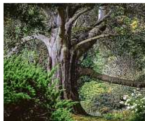
Polský buk BOŽKA PIOTROWSKA