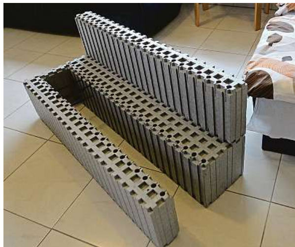
Základem nízkoenergetických staveb jsou materiály a jiná struktura vyzdívání, kombinace výplní a termoizolace.