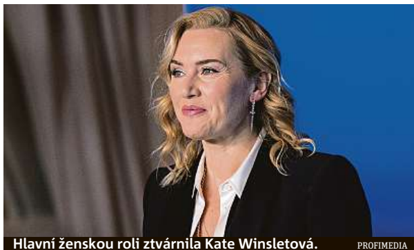
Hlavní ženskou roli ztvárnila Kate Winsletová.

Ať už jste Titanic viděli, nebo ne, film s Leonardem DiCapriem a Kate Winsletovou v hlavních rolích zamilovaného Jacka a Rose je fenomén a odkazy na něj se staly součástí kultury. Pokud vám náhrdelník Srdce oceánu , hit My Heart Will Go On , který nazpívala Celine Dionová,