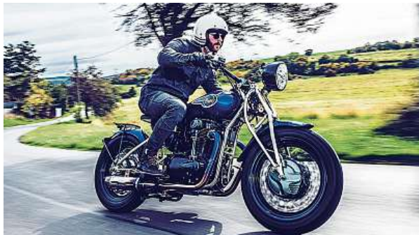
Nový retro motocykl ZS 800

Obnovená Praga, která vyrábí motokáry a závodní auta, uvádí na trh stroj za 80 tisíc eur.