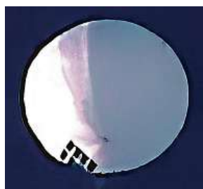
Čínský špionážní balon AP

Peking tvrdí, že balon byl meteorologický. Podle listu už byly obdobné špionážní balony vyslané z Číny spatřeny nad pěti kontinenty.