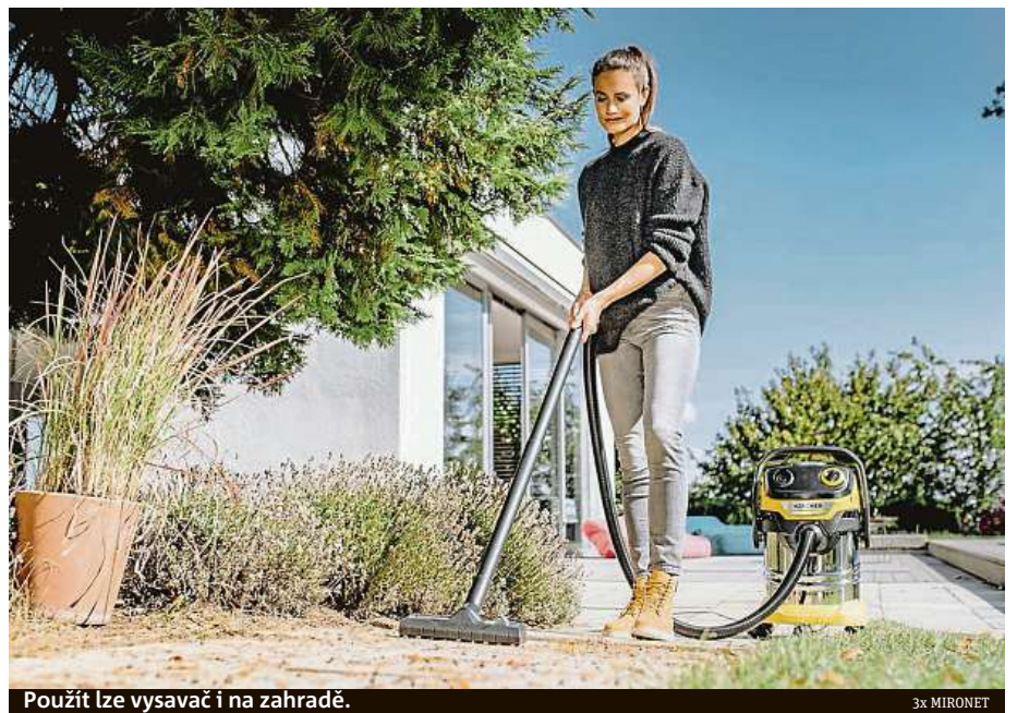
Použit lze vysavač i na zahradě.

kon vysavače. Se spotřebou energie pouhých 1100 wattů pod jeho dotekem zmizí z podlahy všechny nečistoty. Dokonce i ty, které jiné vysavače nejsou schopny uchopit. Automaticky se nabízí otázka, pro koho je prémiový výrobek ideální. Stručně řečeno – pro všechny. Vystačí si s ním hospodyňky obstarávající celý dům, kutilové s vlastní dílnou nebo garáží, rodiny plánující bytovou rekonstrukci a použít ho lze také na vyčištění autosedaček nebo příjezdové cesty. Jeho součástí je také funkce foukání, s níž můžete pohodlně a bez zatěžování zad odváat podzemní pestrobarevné listí někam hodně daleko. Pokud to tedy nebude zahrada vašeho souseda. Tento multifunkční vysavač pořídíte v internetovém obchodu Mironet.cz za 5276 korun.