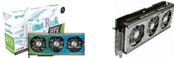
Grafická karta Palit RTX 3080 Ti GameRock

Herní grafická karta vyšší třídy je určena pro nejnáročnější uživatele, kteří chtějí nejvyšší možný grafický výkon bez ohledu na cenu. Vychutnejte si dokonalý herní zážitek ve vysokém rozlišení až 4K (2160p). Tato grafická