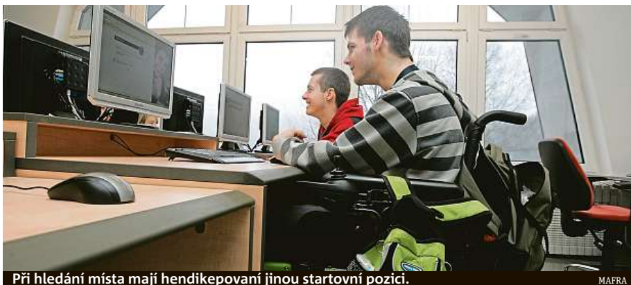
Při hledání místa mají hendikepovaní jinou startovní pozici.

Devět organizací, které zajišťují různé druhy tréninkových pracovních míst, se nyní po několika letech samo-