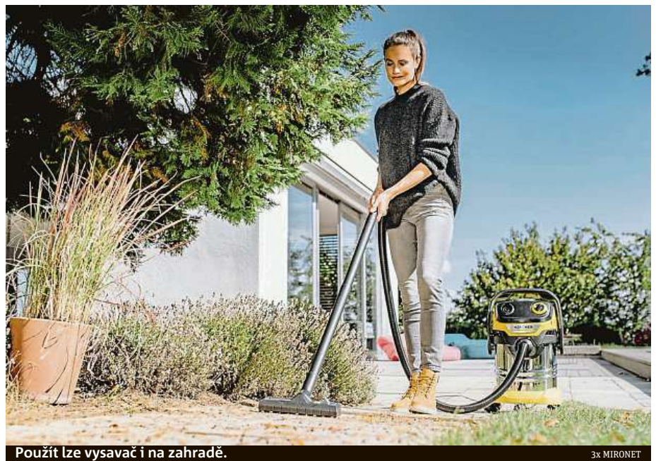
Použit lze vysavač i na zahradě.

kon vysavače. Se spotřebou energie pouhých 1100 wattů pod jeho dotekem zmizí z podlahy všechny nečistoty. Dokonce i ty, které jiné vysavače nejsou schopny uchopit. Automaticky se nabízí otázka, pro koho je prémiový výrobek ideální. Stručně řečeno – pro všechny. Vystačí si s ním hospodyňky obstarávající celý dům, kutilové s vlastní dílnou nebo garáží, rodiny plánující bytovou rekonstrukci a použít ho lze také na vyčištění autosedaček nebo příjezdové cesty. Jeho součástí je také funkce foukání, s níž můžete pohodlně a bez zatěžování zad odváat podzemní pestrobarevné listí někam hodně daleko. Pokud to tedy nebude zahrada vašeho souseda. Tento multifunkční vysavač pořídíte v internetovém obchodu Mironet.cz za 5276 korun.