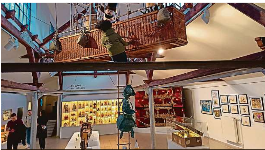
Leitmotivem výstavy je vzducholod' Karla Zemana, jež přivezla všechny loutky. K vidění je mnohem více.

www.dm.cz www.facebook.com/dm_cesko instagram.com/dm_cesko