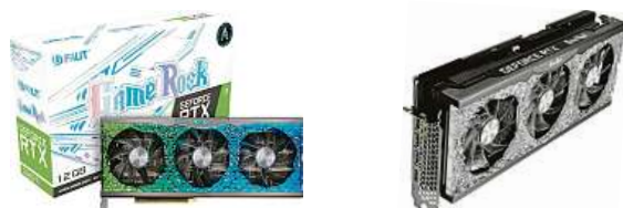
Grafická karta Palit RTX 3080 Ti GameRock

Grafické karty se opět objevují na trhu ve větší hojnosti. Opět si po relativně nedávném nedostatku v tomto odvětví můžete užívat nejvyšší grafický výkon. Představujeme Palit RTX 3080 Ti GameRock s architekturou NVIDIA – Ampere.