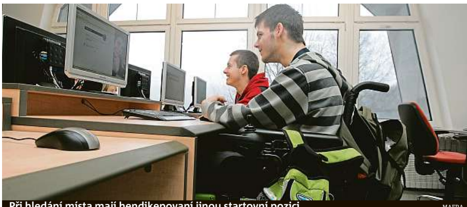
Při hledání místa mají hendikepovaní jinou startovní pozici.

Devět organizací, které zajišťují různé druhy tréninkových pracovních míst, se nyní po několika letech samo-