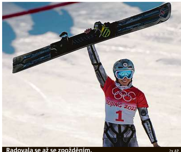
Radovala se až se zpožděním.