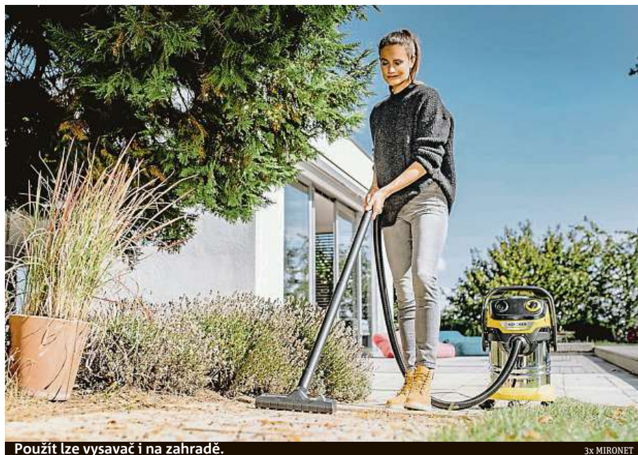
Použit lze vysavač i na zahradě.

kon vysavače. Se spotřebou energie pouhých 1100 wattů pod jeho dotekem zmizí z podlahy všechny nečistoty. Dokonce i ty, které jiné vysavače nejsou schopny uchopit. Automaticky se nabízí otázka, pro koho je prémiový výrobek ideální. Stručně řečeno – pro všechny. Vystačí si s ním hospodyňky obstarávající celý dům, kutilové s vlastní dílnou nebo garáží, rodiny plánující bytovou rekonstrukci a použít ho lze také na vyčištění autosedaček nebo příjezdové cesty. Jeho součástí je také funkce foukání, s níž můžete pohodlně a bez zatěžování zad odváat podzemní pestrobarevné listí někam hodně daleko. Pokud to tedy nebude zahrada vašeho souseda. Tento multifunkční vysavač pořídíte v internetovém obchodu Mironet.cz za 5276 korun.