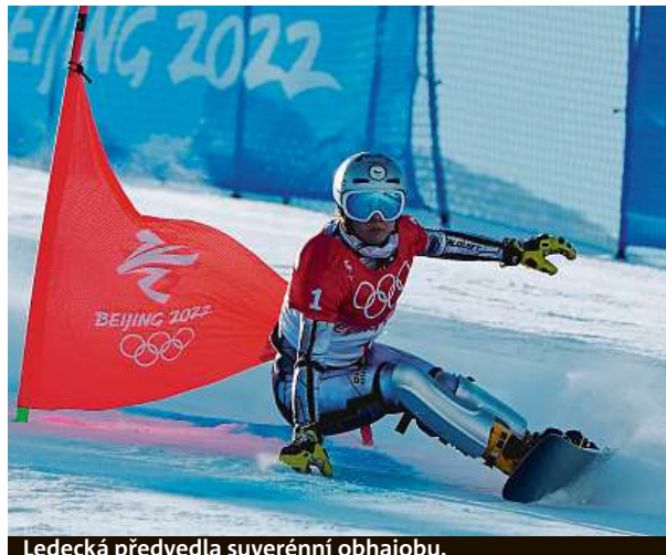
Ledecká předvedla suverénní obhajobu.