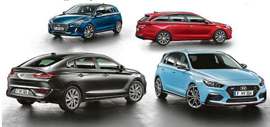
Rodina modelu i30 je konečně kompletní.

Jedná se o Nulové navýšení od 20procentní akontace; Zimní pneu ke každému vozu zdarma; Skipasy do Horní Rokytnice pro celou rodinu; Bonus až 30 tisíc korun