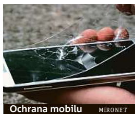
Ochrana mobilu MIRONET

nebo v případě tvrdého nárazu. Podobná nešťastná událost vás díky tomu nevyjde na tisíce korun za opravu a nové díly, ale vyžádá si maximálně investici do nového skla. Například jedny z nejžádanějších ochranných skel FIXED pořídíte v průměru za 300 korun, tedy naprosto zanedbatelnou částku ve srovnání se servisním zásahem. Tvrzená skla tohoto výrobce zaujmají na stupnici tvrdosti hodnotu 9H a jsou tak i při tloušťce 0,33 mm několikrát odolně-