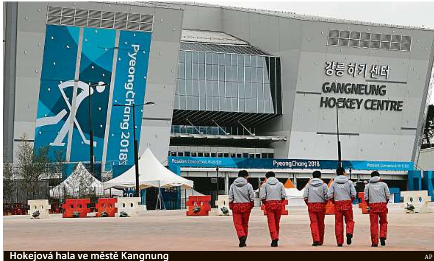
Hokejová hala ve městě Kangnung

Zatímco novodobé olympijské hry odstartovaly již v roce 1896 v Aténách, na svou zimní verzi si počkaly až do meziválečné éry. A svou významnou roli v tom sehrála i Praha. Právě ve stovčaté maticce byl předchozí Týden zimních sportů ve francouzském Chamonix konaný od 25. ledna do 4. února roku 1924 uznán za právoplatnou olympiádu. Stalo se tak i za přispění Jiřího Stanislava Gutha-Jarkovského, autority světového olympijského hnutí a přítele