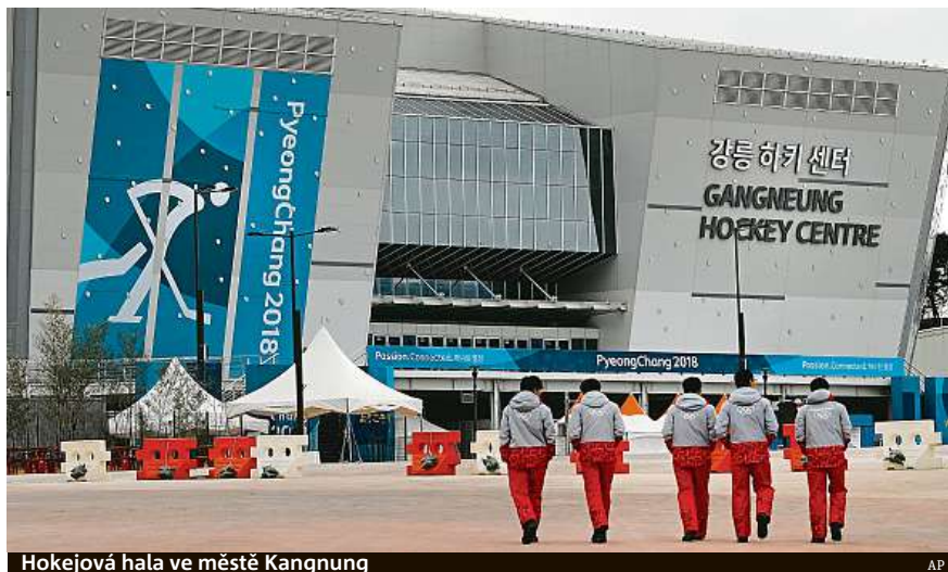
Hokejová hala ve městě Kangnung

Zatímco novodobé olympijské hry odstartovaly již v roce 1896 v Aténách, na svou zimní verzi si počkaly až do meziválečné éry. A svou významnou roli v tom sehrála i Praha. Právě ve stovčaté maticce byl předchozí Týden zimních sportů ve francouzském Chamonix konaný od 25. ledna do 4. února roku 1924 uznán za právoplatnou olympiádu. Stalo se tak i za přispění Jiřího Stanislava Gutha-Jarkovského, autority světového olympijského hnutí a přítele