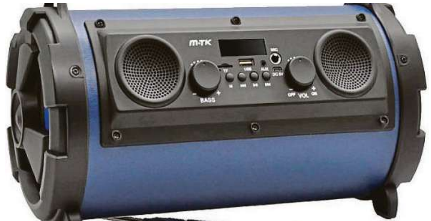
Aligator. Bezdrátový reproduktor české výroby