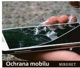
Ochrana mobilu MIRONET

nebo v případě tvrdého nárazu. Podobná nešťastná událost vás díky tomu nevyjde na tisíce korun za opravu a nové díly, ale vyžádá si maximálně investici do nového skla. Například jedny z nejžádanějších ochranných skel FIXED pořídíte v průměru za 300 korun, tedy naprosto zanedbatelnou částku ve srovnání se servisním zásahem. Tvrzená skla tohoto výrobce zaujmají na stupnici tvrdosti hodnotu 9H a jsou tak i při tloušťce 0,33 mm několikrát odolně-