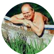
Richardson Mlynařík Hlavně na ty, ve kterých máme šanci získat medaile.