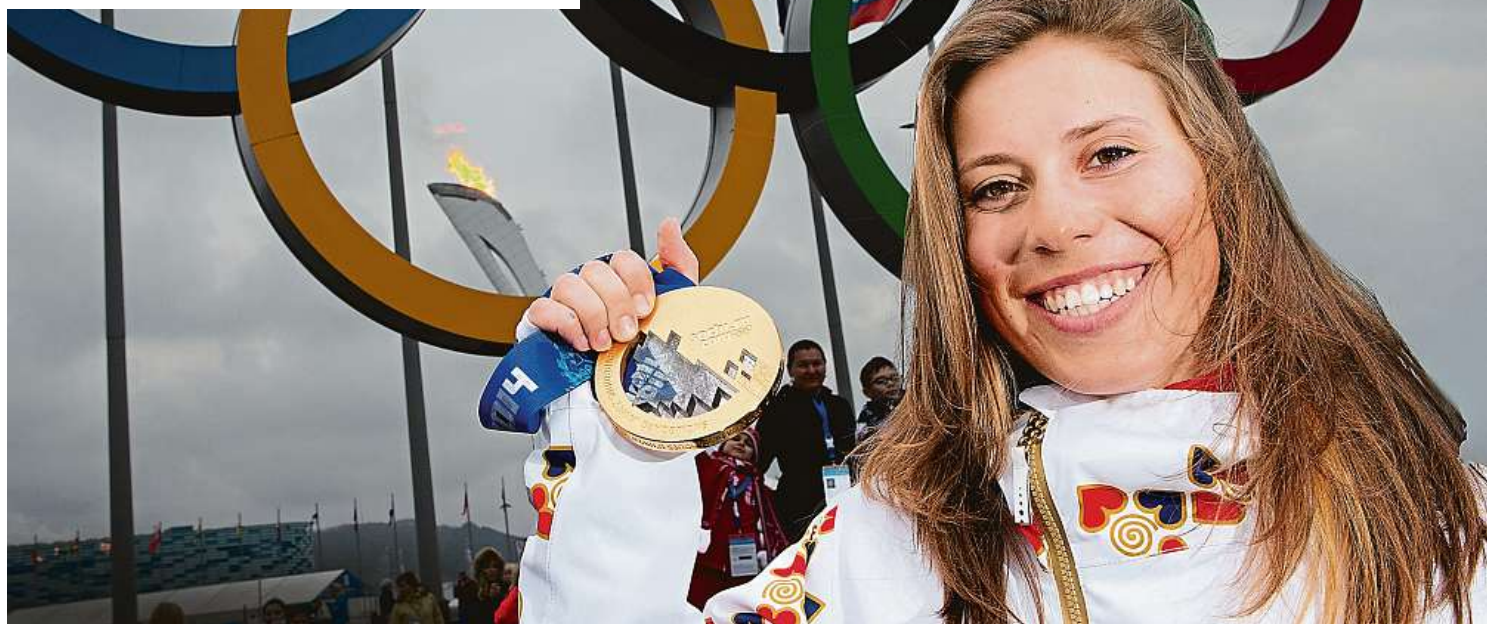
Vlajkonoškou během slavnostního zahájení bude snowboardcrossařka Eva Samková, která obhájí zlatou medaili ze Soči 2014.