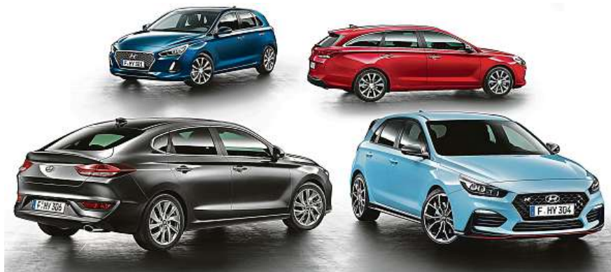
Rodina modelu i30 je konečně kompletní.

Jedná se o Nulové navýšení od 20procentní akontace; Zimní pneu ke každému vozu zdarma; Skipasy do Horní Rokytnice pro celou rodinu; Bonus až 30 tisíc korun