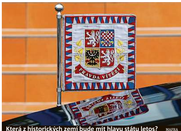
Která z historických zemí bude mít hlavu státu letos?

Čistokrevnými Pražany byli tři muži v nejvyšší ústavní funkci. Antonín Novotný, Václav Havel a Václav Klaus. Pokud bychom počítali hlavní město, kolikrát se jeho rodáci účastnili voleb, včetně těch, kteří nakonec nesplnili podmínky nebo odstoupili z jiných důvodů, figuruje na kandidátkách Praha hned osmnáctkrát. Číslo jí vylep-