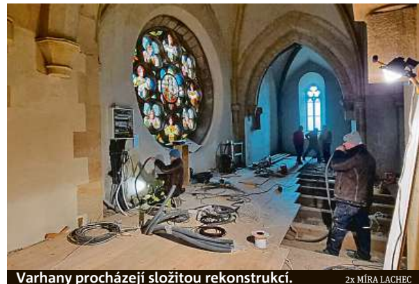
Varhany procházejí složitou rekonstrukcí.

losti a variability, budou zkrátka zvukově barevnější, romantické,“ vysvětluje farář jejich jedinečnost složitého klávesového nástroje. „Pro varhaníky bude lépe dosažitelná interpretace velkých děl francouzské romantické literatury, která vyžadují třímanuálový nástroj,“ popisuje Halama.