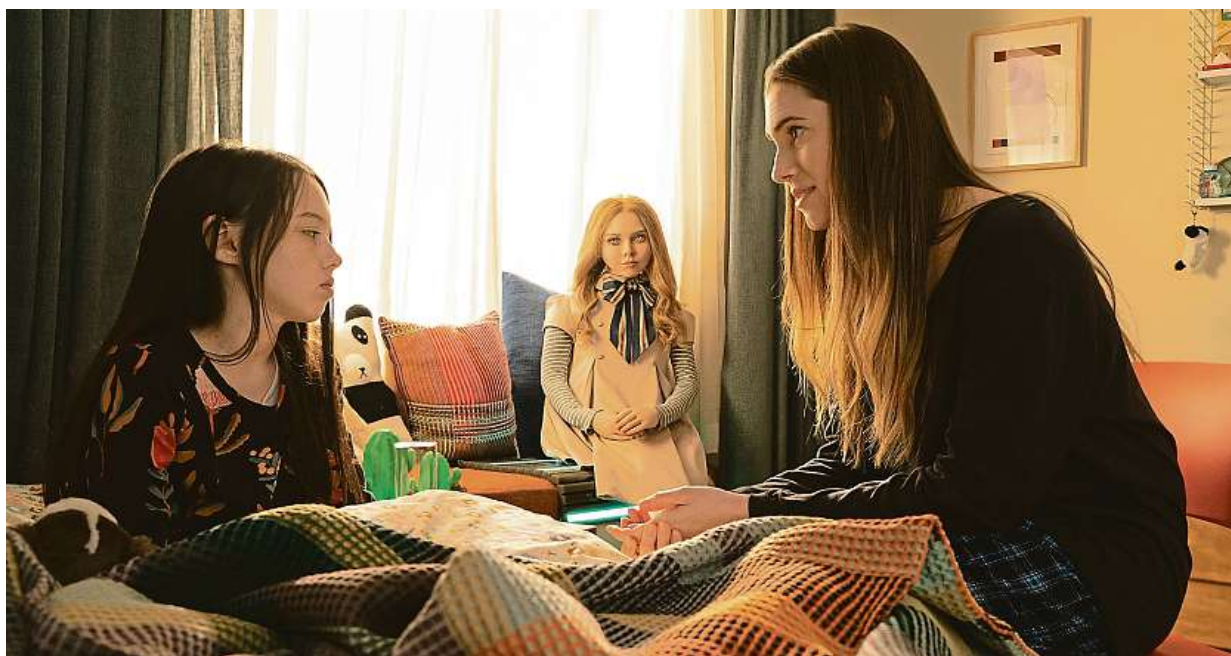
Zleva Cady (Violet McGrawová), M3GAN (Amie Donaldová) a Gemma (Allison Williamsová)