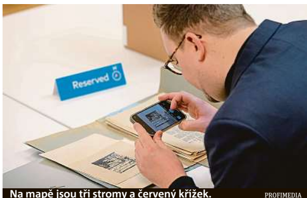
Na mapě jsou tři stromy a červený křížek.

Existence pokladu nebyla nikdy plně prokázána. Institut přesto v roce 1947 podnikl několik neúspěšných pokusů o jeho nalezení. „Nevíme, jestli ten poklad existuje. Institut tuto záležitost pečlivě prověřil a příběh o něm se mu zdál věrohodný. Poklad ale nikdy nenašel. A pokud existoval, mohl ho již někdo vykopat,“ uvádí Anne-Marie Samsonová, mluvčí národního archivu. čTK