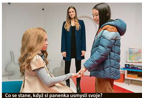
Co se stane, když si panenka usmyslí svoje?

„Fascinují mě věci, které nejprve vypadají naprosto neškodně a mírumilovně, a jednoduše se zvrtnou,“ dodává ke snímku Wan. Co jiného lze čekat od hororového tvůrce, kterého proslavily velmi děsivé filmy o šilených panenkách a posledních jeptiškách. MET