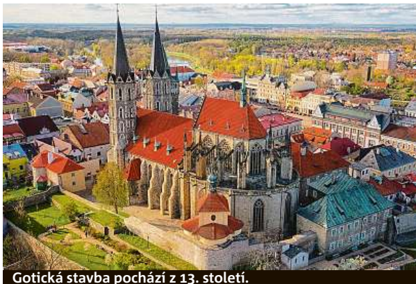
Gotická stavba pochází z 13. století.

„Ještě se vyrobí mříž pod kůrem, díky čemuž bude denně přístup pro veřejnost k nahlédnutí, respektive modlitbě,“ říká farář. Přestože práce ještě běží, kostel je v provozu. Navštívit lze nedělní mše nebo chrám s průvodcem.