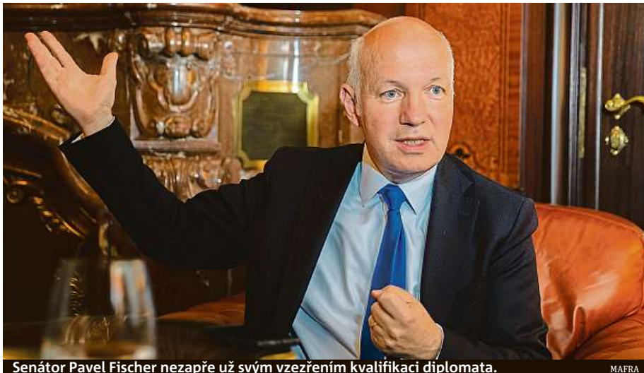
Senátor Pavel Fischer nezapře už svým vzezřením kvalifikaci diplomata.

Moje rodina nejsou jen sourozenci. Strašně si vážím, že mám sestry a bráchy, kteří mají porozumění pro to, co dělám, a podporují mě. Mám ale i desítky neteří a synovců, ti se minule do kampaně zapojili a ohromně pomáhali. Mám spoustu bratřanců a sestřenic, spoustu příbuz-