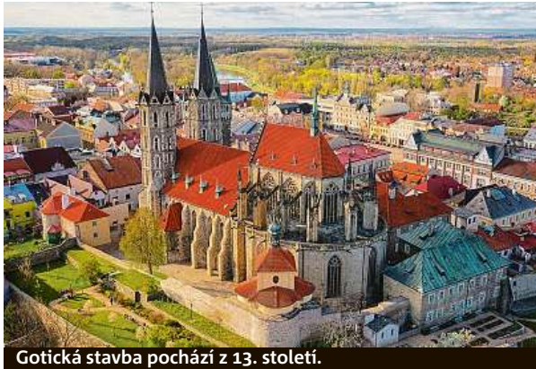
Gotická stavba pochází z 13. století.

„Ještě se vyrobí mříž pod kůrem, díky čemuž bude denně přístup pro veřejnost k nahlednutí, respektive modlitbě,“ říká farář. Přestože práce ještě běží, kostel je v provozu. Navštívit lze nedělní mše nebo chrám s průvodcem.