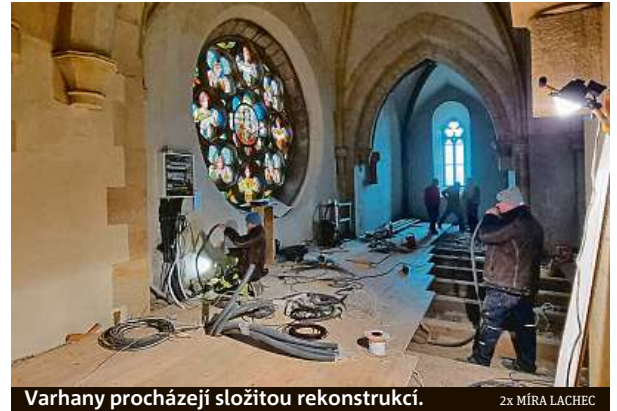
Varhany procházejí složitou rekonstrukcí.

losti a variability, budou zkrátka zvukově barevnější, romantické,“ vysvětluje farář jejich jedinečnost složitého klávesového nástroje. „Pro varhaníky bude lépe dosažitelná interpretace velkých děl francouzské romantické literatury, která vyžadují třímanuálový nástroj,“ popisuje Halama.