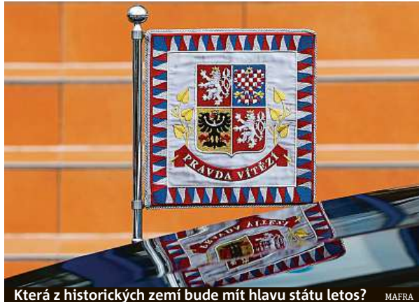
Která z historických zemí bude mít hlavu státu letos?

Čistokrevnými Pražany byli tři muži v nejvyšší ústavní funkci. Antonín Novotný, Václav Havel a Václav Klaus. Pokud bychom počítali hlavní město, kolikrát se jeho rodáci účastnili voleb, včetně těch, kteří nakonec nesplnili podmínky nebo odstoupili z jiných důvodů, figuruje na kandidátkách Praha hned osmnáctkrát. Číslo jí vylep-