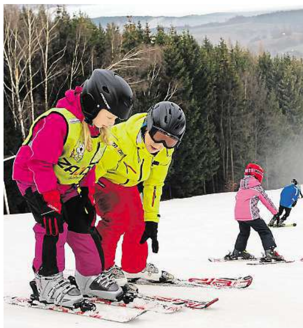
Děti jsou na sjezdovkách nejzranitelnější.

Děti je však nutné učit opatrnosti i při běžném pohybu