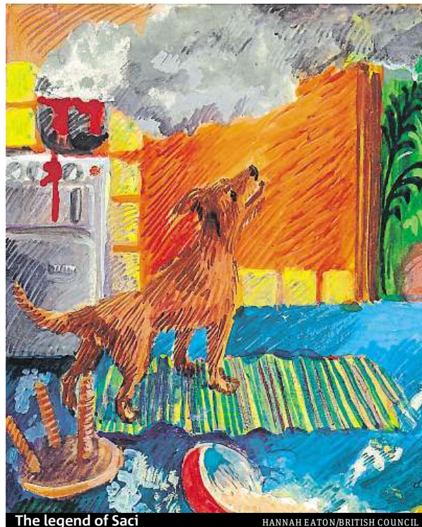
The legend of Saci