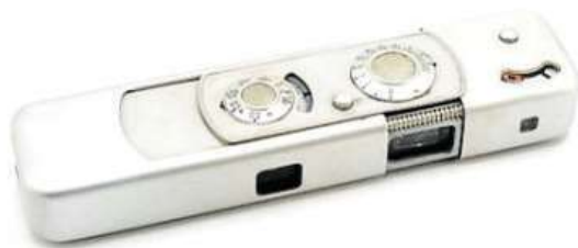
Miniaturní fotoaparát Tessina

Expozice v Paříži ukazuje skutečné špionážní pomůcky a přibližuje verbování, výcvik a vybavení tajných agentů při misích.