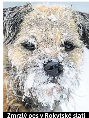
Zmrzlý pes v Rokytské slati