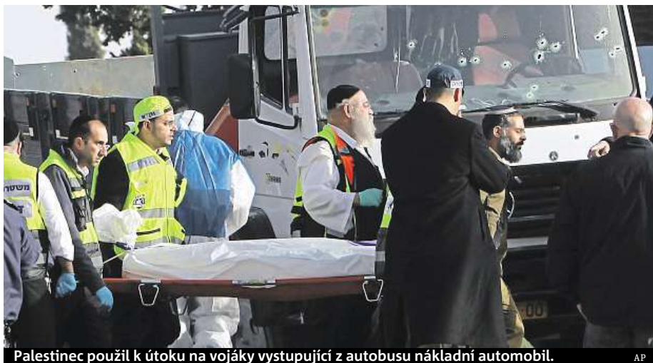
Palestinec použil k útoku na vojáky vystupující z autobusu nákladní automobil.

„Je samozřejmě možné, že byl ovlivněn sledováním televize, ale je obtížné se dostat do hlavy každého jednotlivce