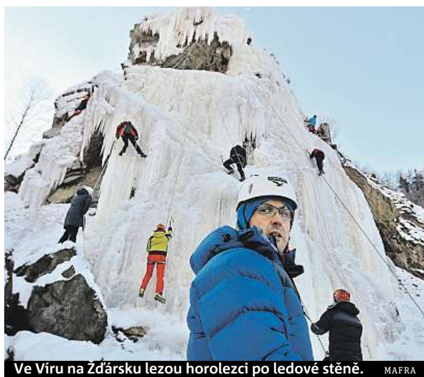
Ve Víru na Žďársku lezou horolezci po ledové stěně.